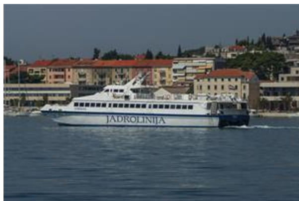
Slika 6. Katamaran Dubravka brodara Jadrolinija