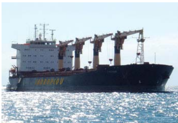
Slika 7. Brod za rasuti teret M.B. Trogir brodara Jadroplov

Jadroplov d.d. osnovan je 1947. godine sa sjedištem u Rijeci, koje se nakon 1956. godine prenosi u Split. Bavi se međunarodnim pomorskim prijevozom robe, a upravlja s osam brodova za rasute terete, ukupne tonaže 217 468 00 GT i 378 101 00 DWT.