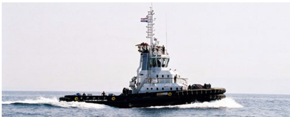
Slika 5. Tegljač Gea brodara Jadranski pomorski servis

Započinje sa radom 1956. godine, a dioničkim društvom postaje 1994. godine. Pruža usluge tegljenja, spašavanja, dizanja teških tereta pontonskom dizalicom, prijevoza nafte i naftnih derivata, a među osnovnim djelatnostima nalazi se i ekološka zaštita mora. Važan je čimbenik sigurnosti plovidbe na području sjevernog Jadrana, a najčešće intervenira pri odsukavanju nasukanih plovila, gašenju požara na brodovima i tegljenju onesposobljenih plovila do luka. Upravlja sa 11 tegljača, tri teglenice te jednom pontonskom dizalicom, ukupne tonaže 4907 GT i 3178 DWT.