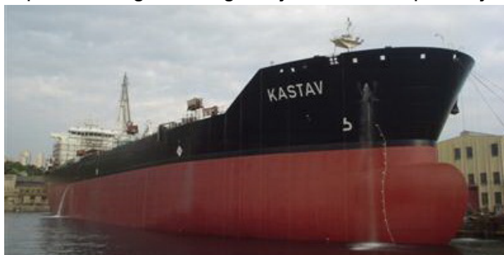
Slika 8. Tanker Kastav brodara Uljanik plovidba

Tablicom 9. prikazano je stanje flote brodara Uljanik plovidba d.d., Pula imena i tipovi brodova, njihova zapremnina, godina izgradnje te zastava pod kojom plove.