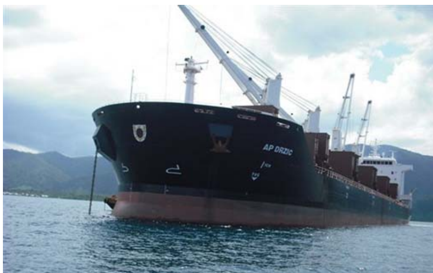
Slika 3. Brod AP Držić brodara Atlantska plovidba

Atlantska plovidba d.d. nastavlja se na višestoljetnu pomorsku dubrovačku tradiciju, a djeluje od 1955. godine. Cijenjena je i ustrojena prema svjetskim kriterijima, a osnovna joj je djelatnost pomorski prijevoz rasutih tereta, no uspješno se bavi i turizmom. Nastoji održati neovisan položaj na tržištima rasutih i teških tereta te ispunjavati potrebe domaćih i međunarodnih klijenata. Navedeno postiže opredjeljivanjem za visoke norme upravljanja uz osobiti naglasak na pomorsku sigurnost, provođenje sigurnog poslovanja, kao i zaštitu pomorskog okoliša. Društvo upravlja s 13 brodova za rasute terete, dva broda za teške terete, ukupne tonaže 488 503,00 GT i 872 985,00 DWT.