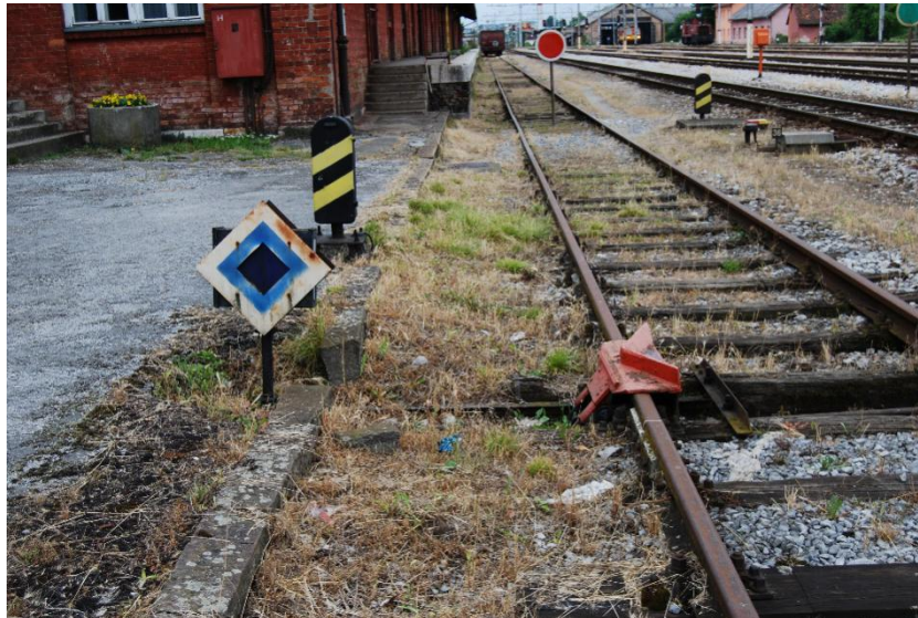
Slika 5. Iskliznica u kolodvoru Karlovac.

U kolodvoru Karlovac svim iskliznicama rukuje se centralno s kolodvorske postavnice. One se koriste kako se pri slučajnom pomicanju vagona ili kretanja lokomotive ne bi ugrozili putovi vožnje. Kolodvor Karlovac ima 7 iskliznica.