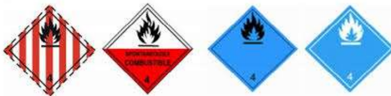
Slika 5 Listice opasnosti klase 4

Pripadajuće listice za ovu klasu prikazane su na slici 5.