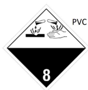
Slika 9 Listica opasnosti klase 8

Pripadajuće listice opasnosti prikazane su na slici 9.