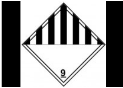
Slika 10 Listice opasnosti klase 9

Listice opasnosti za klasu 9 prikazane su na slici 10.