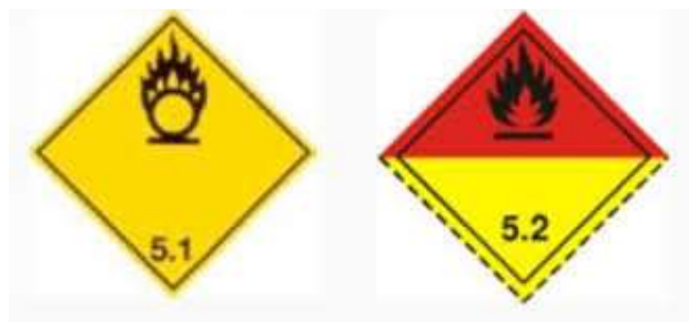
Slika 6 Listice opasnosti klase 5

Listice kojima se označava ova klasa prikazane su na slici 6.