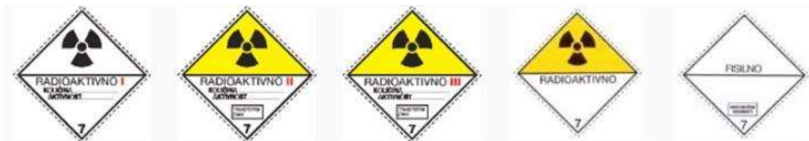
Slika 8 Listice opasnosti klase 7

Listice opasnosti za ovu klasu prikazane su na slici 8.