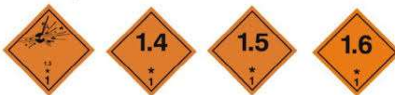
Slika 2 Listice opasnosti klase 1

skupina: 1.1 tvari ili predmeti koji mogu izazvati masovnu eksploziju; 1.2. tvari ili predmeti koji ne izazivaju masovnu eksploziju ali mogu biti pogibeljni; 1.3 tvari koje mogu izazvati požar, ali eksplozivno manje opasne; 1.4 tvari ili predmeti od kojih nema veće opasnosti od eksplozije ili zapaljenja; 1.5 neosjetljive tvari ili predmeti koji uporabom mogu izazvati masovne eksplozije; 1.6 neosjetljive tvari ili predmeti koji ne mogu izazvati masovnu eksploziju. [4]