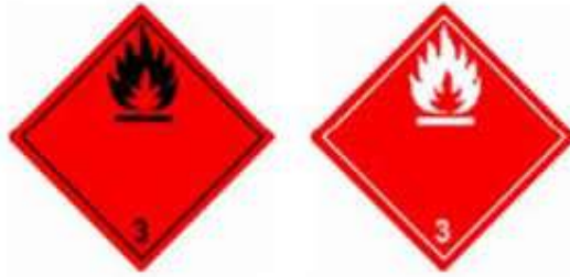
Slika 4 Listice opasnosti klase 3

Listice opasnosti klase 3 prikazane su na slici 4.