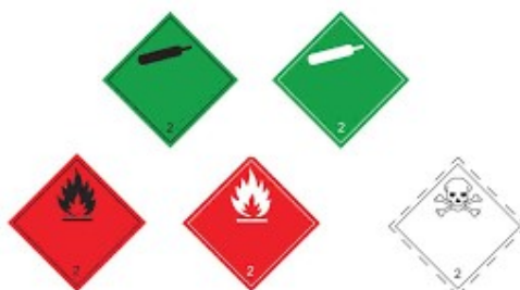
Slika 3 Listice opasnosti klase 2

Plinovi: stlačeni, tekući i otopljeni pod tlakom su tvari koje pri 50° C imaju tlak para viši od 3 bara ili se pri 20°C i standardnom tlaku (1 bar) nalaze u plinovitom stanju.4 Listica opasnosti za klasu 2 prikazana je na slici 3. [4]