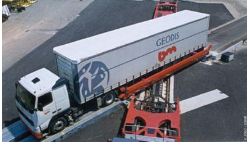
Slika 4. Bočni ukrcaj Modalohr tehnologija