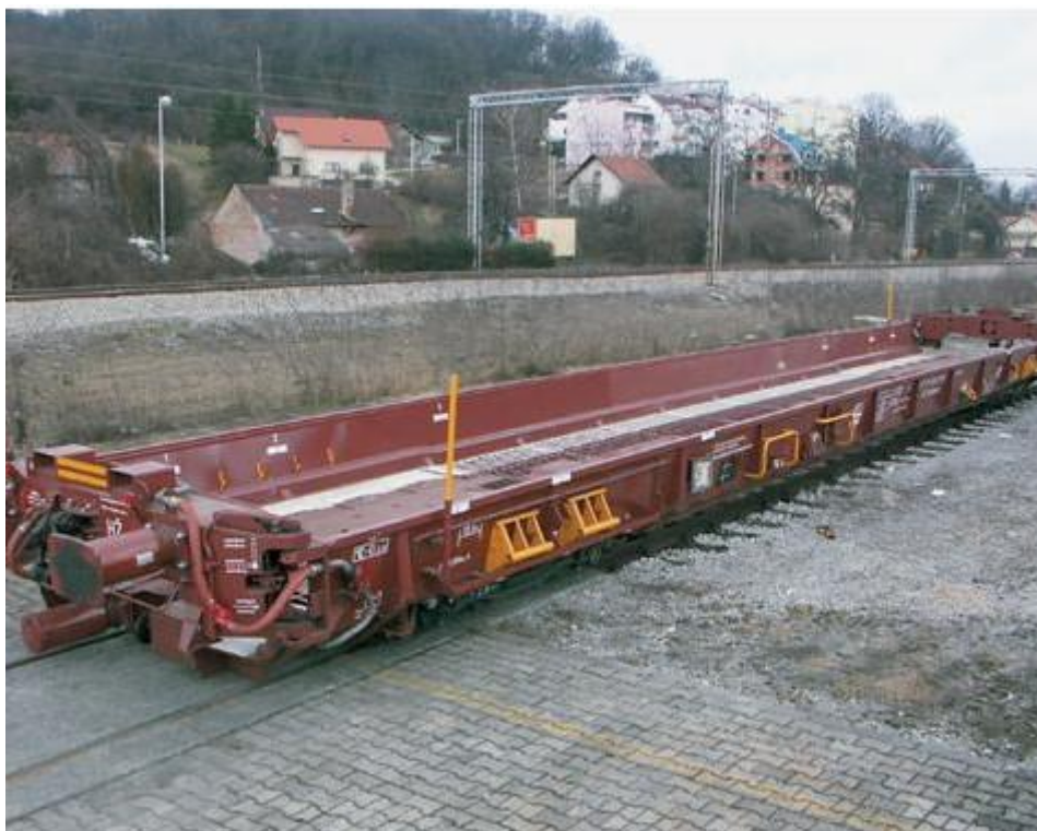
Slika 5. Saadkms vagon u terminalu Vrapče