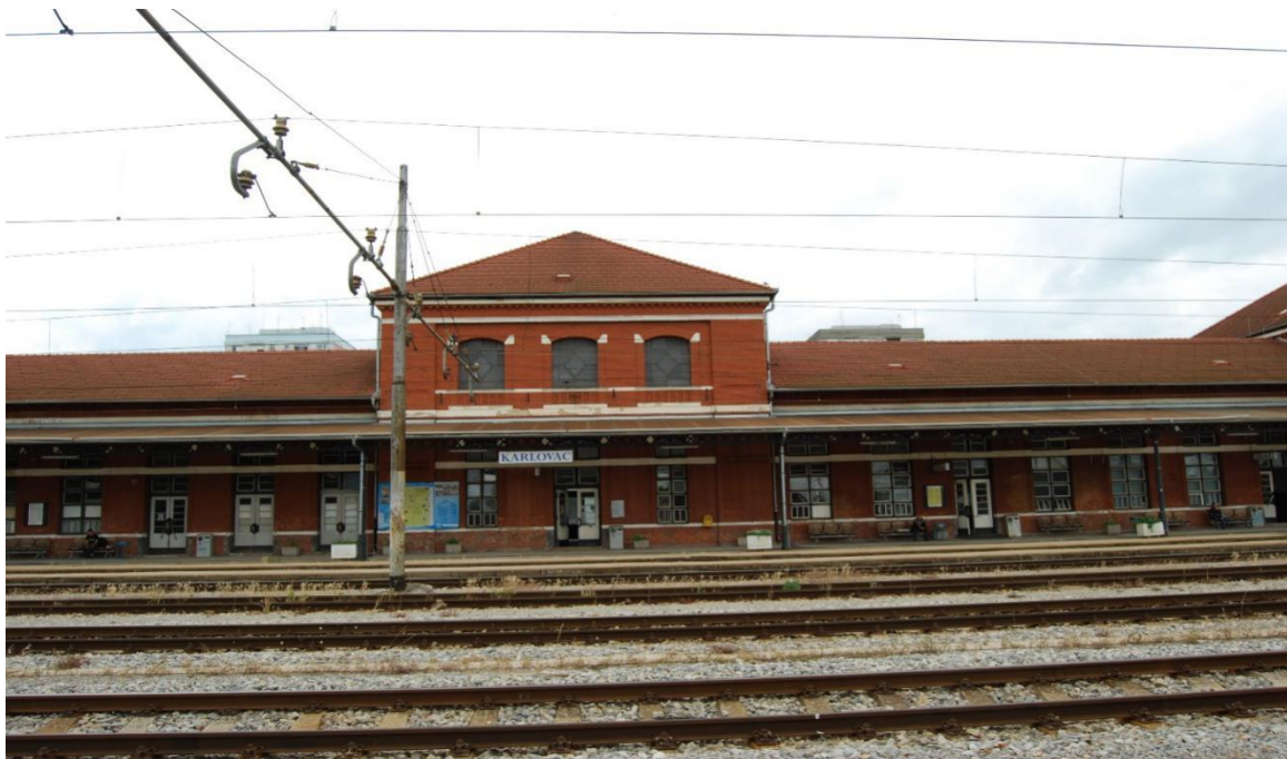
Slika 1. Kolodvorska zgrada u kolodvoru Karlovac

Kolodvorsko prihvatna zgrada izgrađena je od cigle, a njezine dimenzije su 120,8 x 11,8 metara.