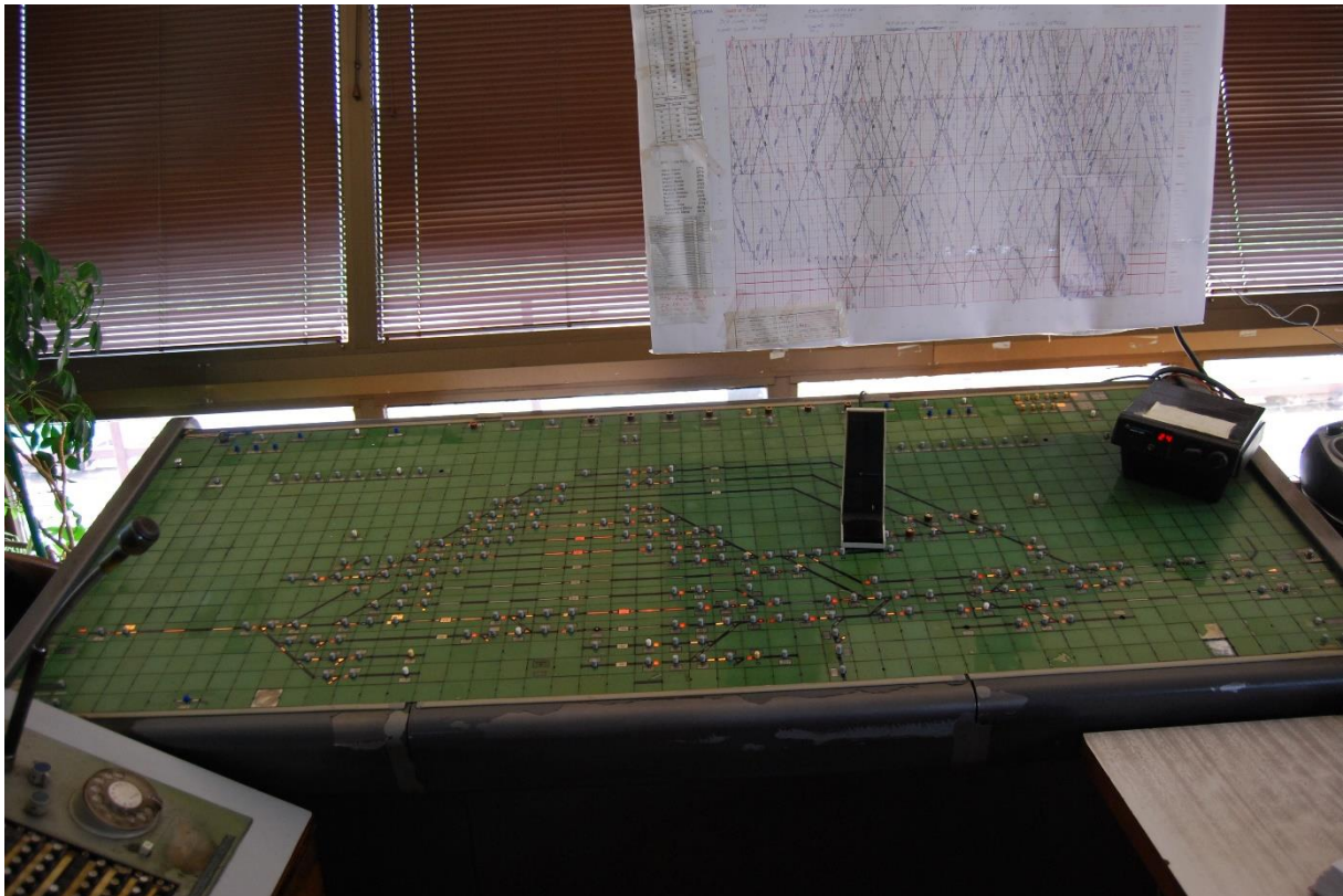
Slika 6. Komadni stol elektro-relejnog uređaja „SpDr Lorenz 30“ u prometnom uredu kolodvora Karlovac.