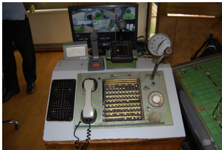
Slika 7. Telekomunikacijski pult u kolodvoru Karlovac