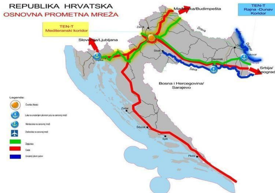
Slika 2. Osnovna prometna mreža RH