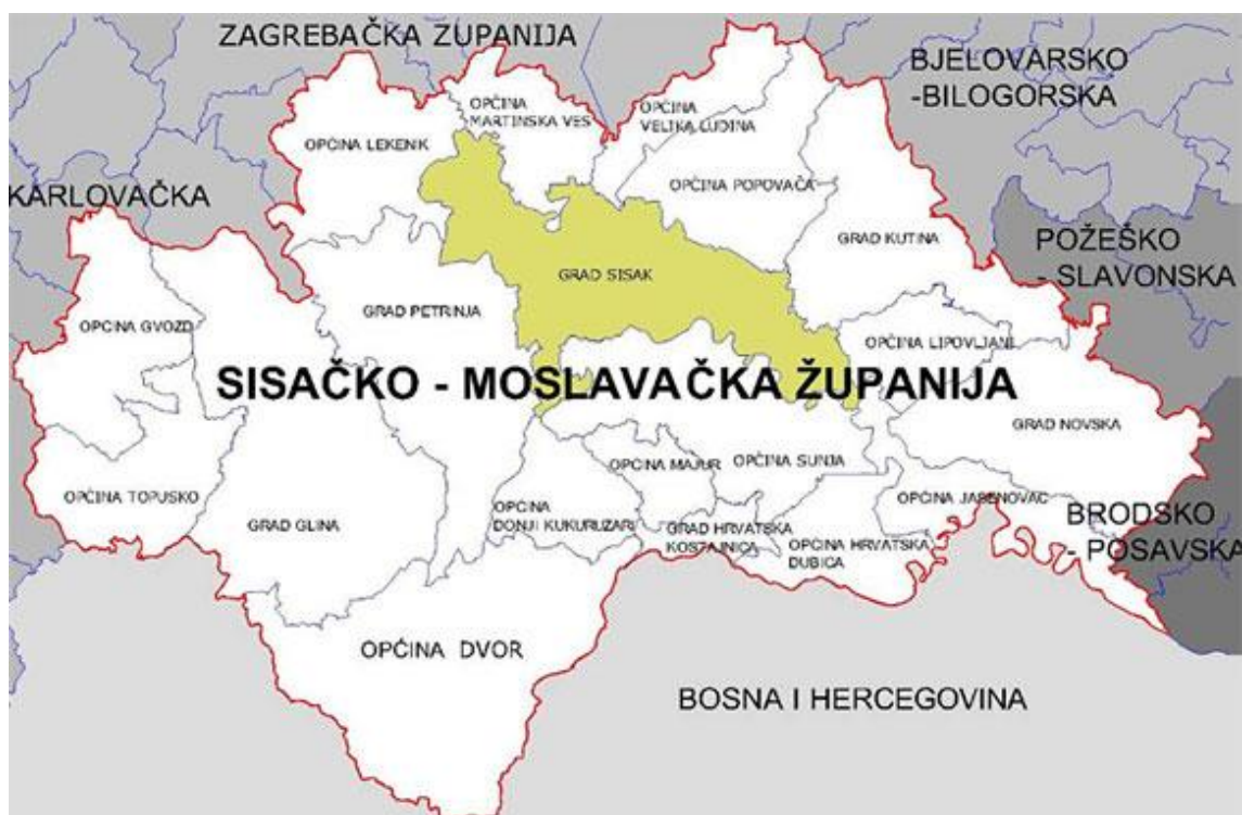
Slika 1. Položaj Sisačko-moslavačke županije, [5]

Na slici 1 prikazan je položaj Sisačko-moslavačke županije zajedno sa gradovima i općinama koje ju čine.