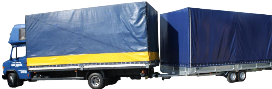
Slika 3. Odvojivi sanduk s ceradom na prikolici

Transportni uređaji obuhvaćaju različite vrste naprava čija je glavna zadaća prihvat – smještaj roba pri procesima manipulacije, premještaja ili prijevoza. Glavne vrste transportnih uređaja su izmjenjive transportne posude, kontejneri, palete, te čitavi niz transportnih posuda sa jednakom zadaćom, kao i sanduci, bačve, gajbe, košare i paketi. Izmjenjive transportne posude su odvojive nadgradnje cestovnih teretnih vozila. Radi se o sanduku cestovnog teretnog vozila, prikolice ili poluprikolice (slika 3.) koji se, može odvojiti od podvozja.