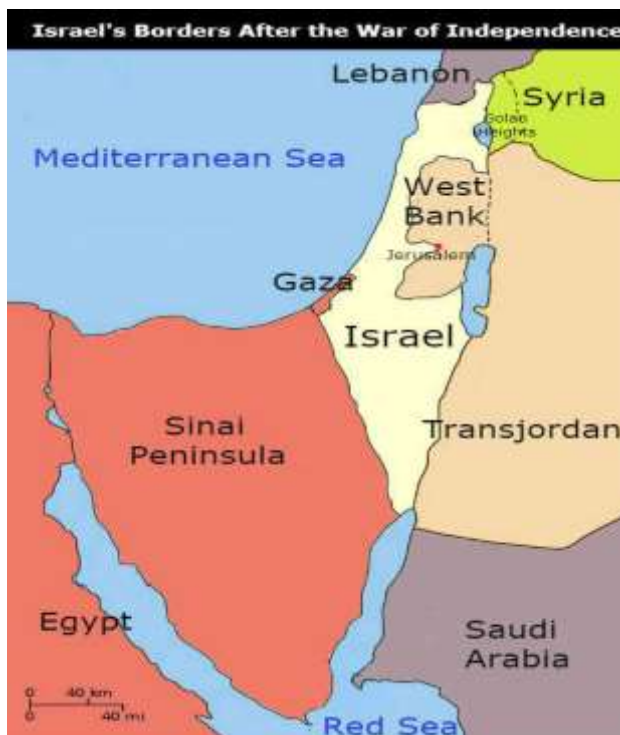
Slika 5. Granice Izraela nakon rata za neovisnost