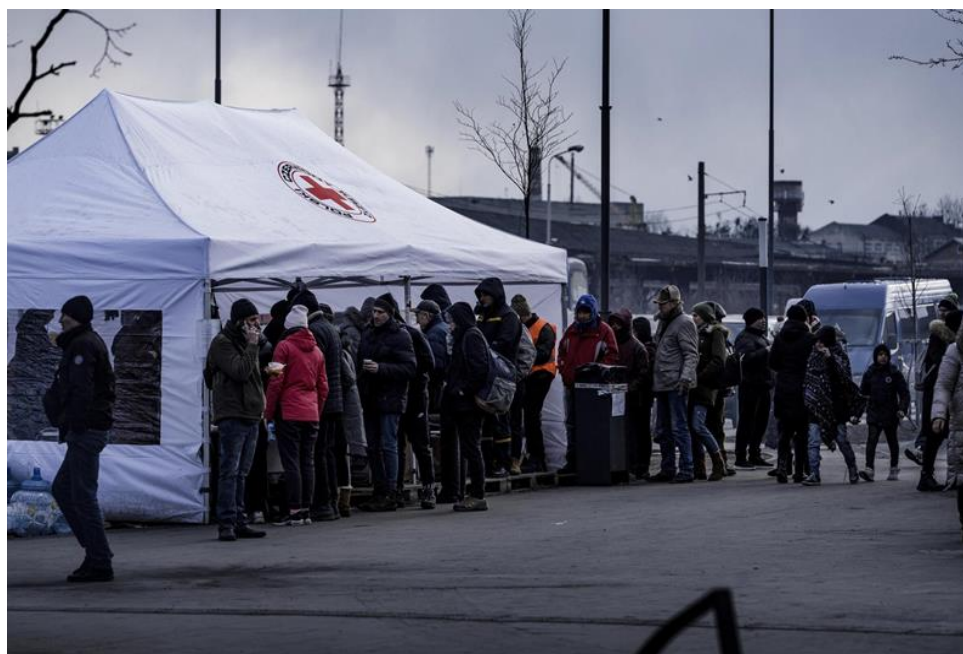
Slika 3. Gužva na graničnim prijelazima