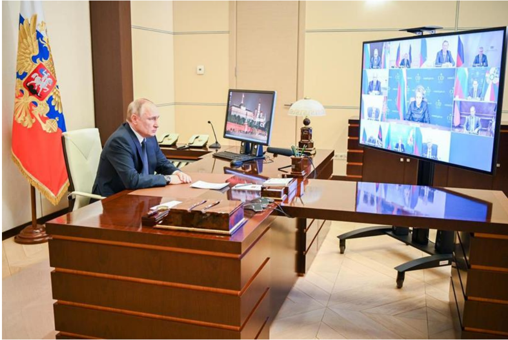
Slika 10. Predsjednik Rusije Vladimir Putin