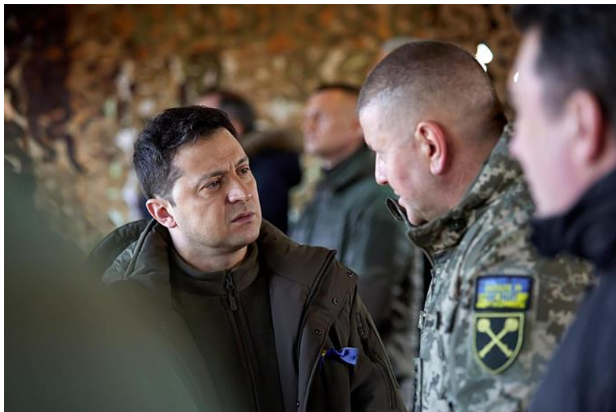
Slika 11. Predsjednik Ukrajine Volodimir Zelenski

Predsjednik Rusije, Vladimir Putin u svim člancima, gotovo je uvijek u istom izdanju. Hladnog, ozbiljnog pogleda, obučen u tamnoplavo odijelo, s rukama položenim na veliki stol u njegovom uredu, odaje dojam moćnog i odlučnog vladara.