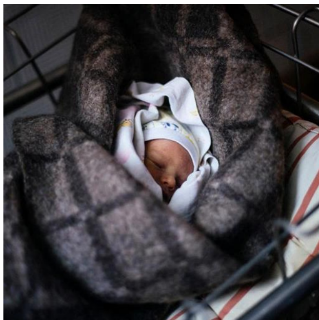
Slika 8. Novi životi u ratnoj Ukrajini