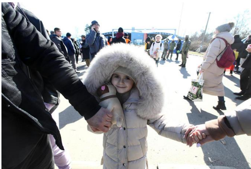
Slika 7. Slika djevojčice s granice