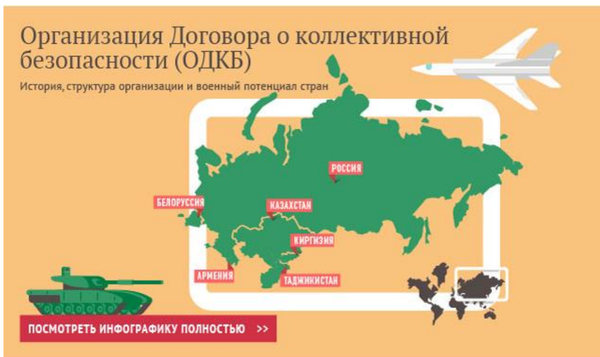
Slika 2: Države članice Organizacije Sporazuma o kolektivnoj sigurnosti (ODKB)

odnosu na europski model integracija pa, ako uspoređujemo NATO i ODKB, dolazimo do sličnog zaključka. Na čelu ODKB-a također se nalazi glavni tajnik, postoji Parlamentarna skupština s godišnjim rotirajućim predsjedništvom, dok se Sporazumom o kolektivnoj sigurnosti određuju obveze država potpisnica o nepristupanju drugim vojnim savezima i pristanku svih članica u slučaju da treća zemlja želi otvoriti vojnu bazu u nekoj od članica. Također postoji i članak 4. koji obrazlaže da napad na jednu članicu ujedno predstavlja čin agresije na cijeli savez te su države članice 2009. osnovale Zajedničke snage za brzo djelovanje (Karimov, 2021)