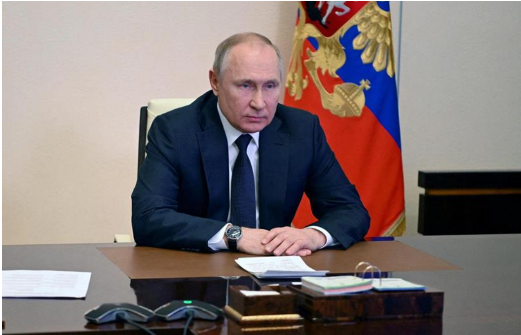
Slika 9. Predsjednik Rusije Vladimir Putin

Večernji list donosi i slike vladara suprostavljenih zemalja.