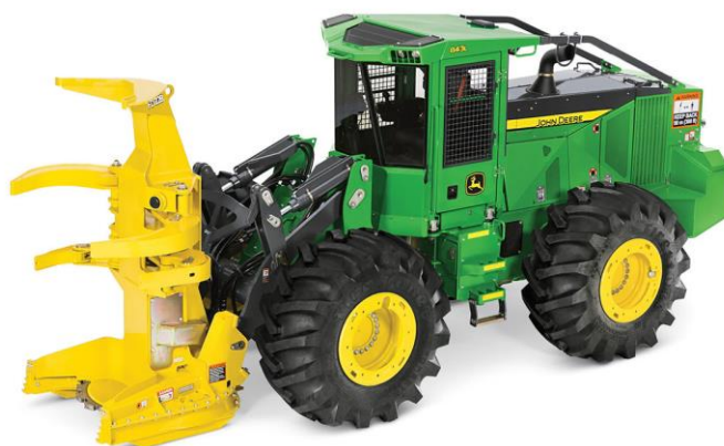
Slika 7.10 Šumarski traktor tvrtke John Deere.

Najčešće su pogonjeni s motorima s kompresorskim paljenjem raspona snage od 25 kW do 75 kW. Upotreba je za radove i prijevoz u šumi. Prema [4].