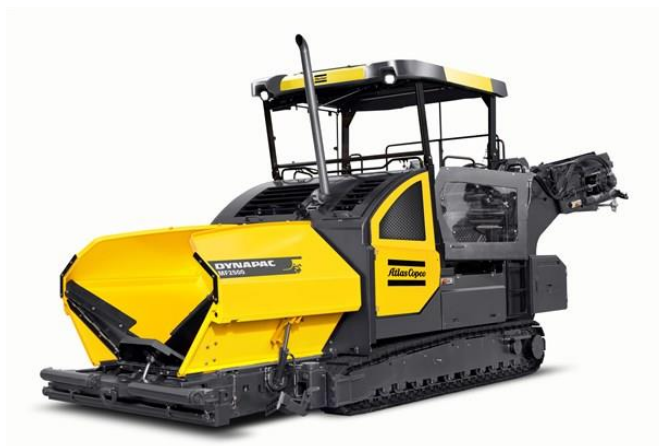
Slika 7.5 Stroj za asfaltiranje cestovne infrastrukture.