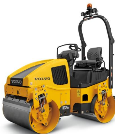
Slika 7.1 Građevinski valjak.

Koriste se za završne radove prilikom gradnje prometnica, njihova svrha je sabijanje i ravnjanje podloge. Najčešći pogon viličara je motor s unutarnjim izgaranjem kompresijskim paljenjem snage do 380kW. U novijim izvedbama i manjim modelima snage motora se kreću do 55 kW. Prema [4].