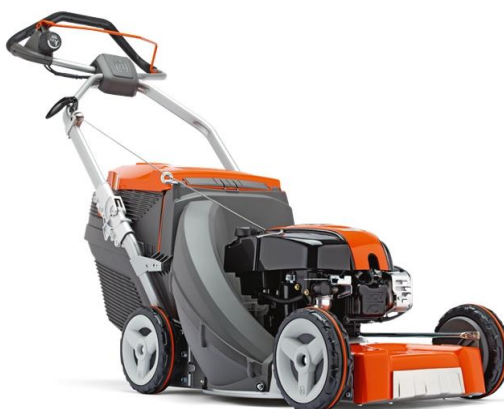
Slika 7.11 Kosilica za domaćinstvo.

Najčešći pogon korištena u kosilicama u domaćinstvu su dvotaktni i četverotaktni motori s vanjskim izvorom paljenja. Snage motora kreću se od 1 kW do 10 kW. Zapremnina motora se kreće od 100 kubičnih centimetara do 250 kubičnih centimetara. Prema [4].