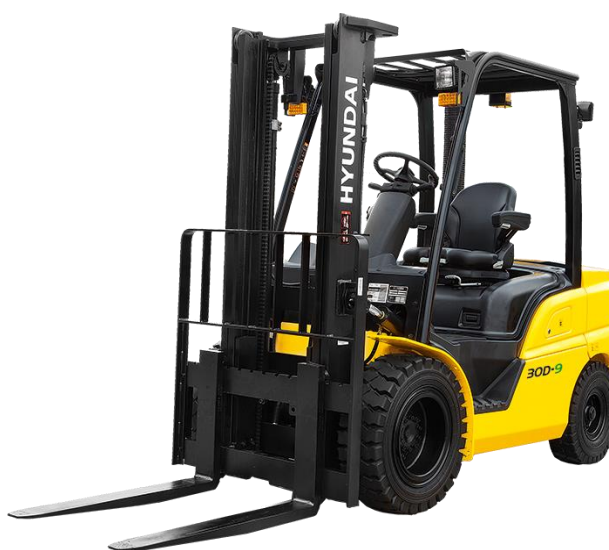
Slika 7.6 Viličar marke Hyundai.

Ako se radi o viličaru koji se koristi za rad u zatvorenom prostoru onda su pogonjeni elektromotorom. Osim elektromotorom, mogu biti pokretani i motorima s unutarnjim izgaranjem, s vanjskim izvorom paljenja i s kompresijskim paljenjem. Snage im se kreću od 20 kW do 100 kW. Prema [4].