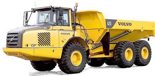
Slika 7.3 Kiper tvrtke Volvo.

Postoje kiperi raznih veličina, manji kiperi se koriste na gradilištima, najčešće za pogon koriste motor s unutarnjim izgaranje koji zapaljenje vrši kompresijskim putem. Snaga motora se kreće od 50 kW do 500 kW. Prema [4].