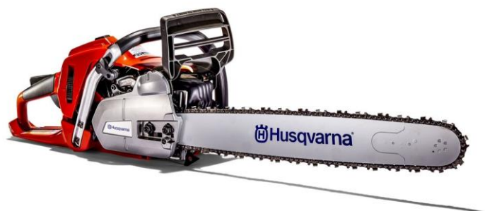
Slika 7.8 Profesionalna motorna pila tvrtke Husqvarna.

Pogon koji se koristi za profesionalne motorne pile je dvotaktni motor s unutarnjim izgaranjem s vanjskim izvorom paljenja. Raspon snage im se kreće od 2 kW do 6 kW. Prema [4].