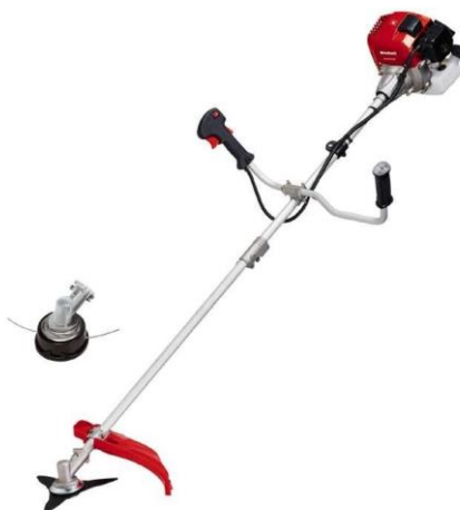
Slika 7.12 Trimer korišten u domaćinstvu.

Uglavnom pogonjeni dvotaktnim motorima s vanjskim izvorom paljenja, a snage im se kreću od 0,25 kW do 1,4 kW. Prema [4].