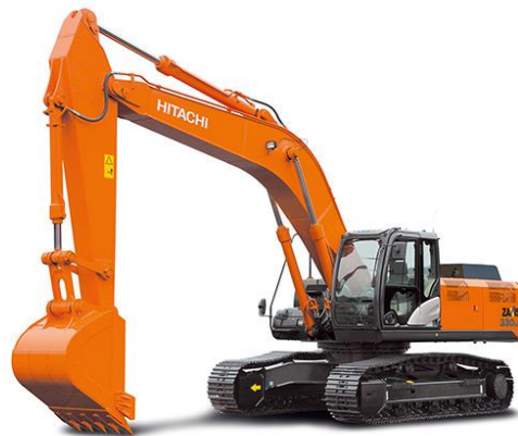
Slika 7.2 Rovokopač proizvođača Hitachi.

Glavna upotreba je iskopavanje i premještanje zemlje. Razlikuju se po veličini i snazi motora s unutarnjim izgaranjem koji se ugrađuje u njih. Postoji više kategorija rovokopača.