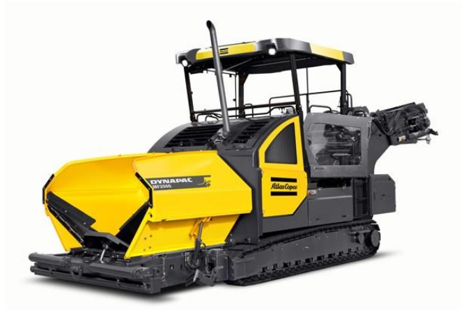
Slika 7.5 Stroj za asfaltiranje cestovne infrastrukture.