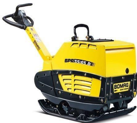
Slika 7.4 Stroj za sabijanje podloge.

Strojevi za sabijanje podloge najčešće su pogonjeni dvotaktnim motorima s vanjskim paljenjem, čija je snaga od 1 kW pa sve do 3 kW. Razlikujemo još i strojeve za sabijanje podloge pogonjene četverotaktnim motorima s vanjskim izvorom paljenja ili kompresorskim paljenjem. Snaga im se kreće od 2 kW do 21 kW. Prema [4].