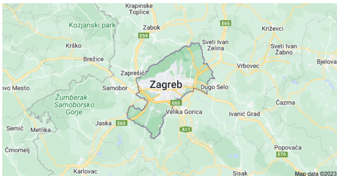
Slika 1. Položaj grada Zagreba i Zagrebačke županije