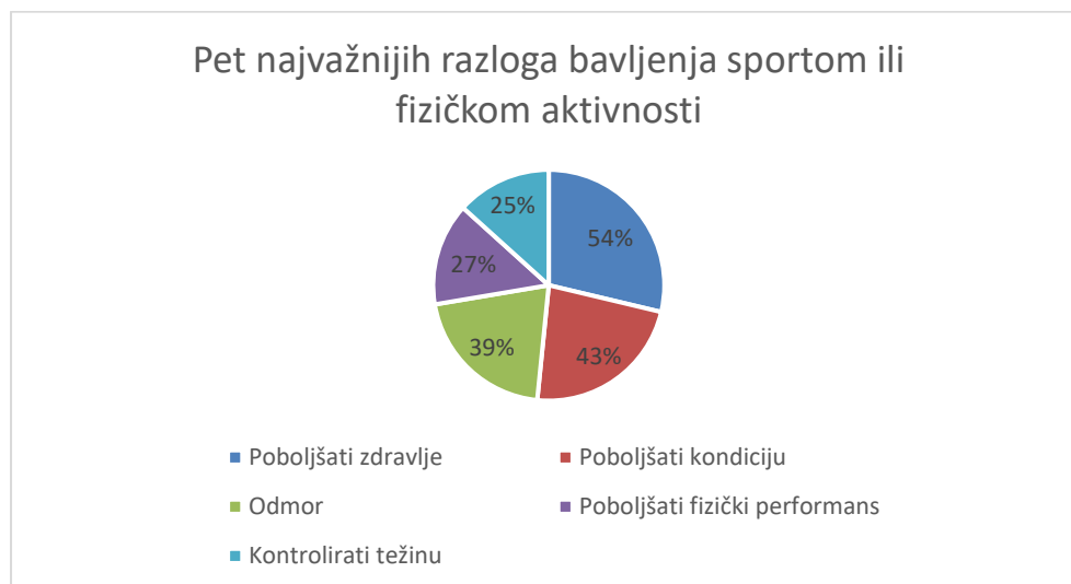
Grafikon 1.: Pet najvažnijih razloga bavljenja sportom ili fizičkom aktivnosti

Izvor: samostalna izrada autora prema Eurobarometer, 2022.