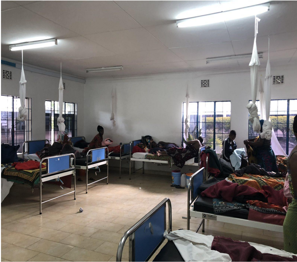
Slika 8. Rodilište u LHCC-u, Arusha, Tanzania