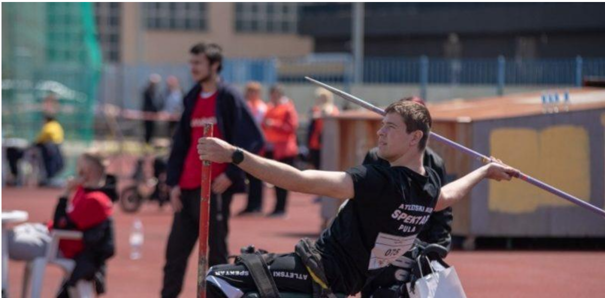
Slika 1. Paraaletika.

Međunarodno upravljanje paraatletikom za osobe sa tjelesnim invaliditetom nadzire Svjetski paraatletski pododbor, paraatletiku za osobe sa intelektualnim poteškoćama Međunarodna sportska federacija za osobe sa s intelektualnim invaliditetom, a atletikom gluhih osoba upravlja Međunarodni odbor za sport gluhih (31).