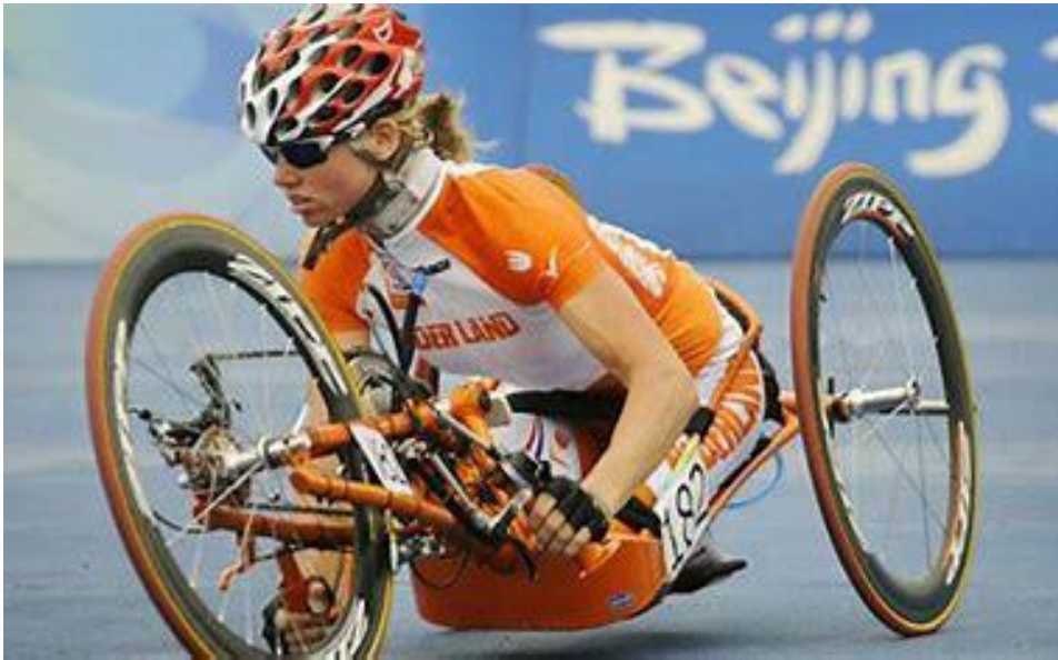
Slika 4. Biciklizam na ručni pogon.

sustav klasifikacije temeljen je na funkcijama sportaša te dopušta mješovita oštećenja unutar kategorije što znači da je moguće da se sportaš s lokomotornim oštećenjem natječe protiv sportaša koji ima poremećaj koordinacije. Svaka kategorija ima vlastiti skup pravila i prilagodbi opreme kako bi se prilagodila invaliditetu sportaša (55).