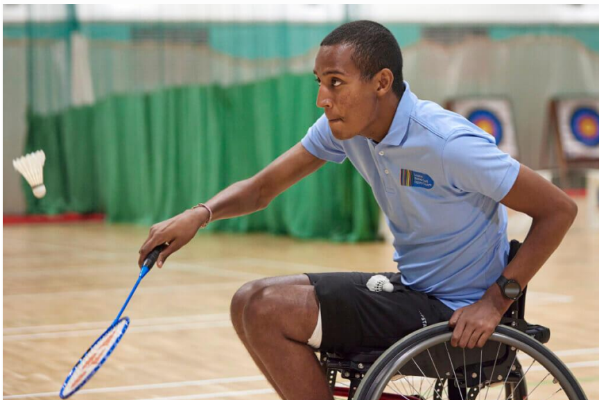
Slika 6. Parabadminton.

Parabadminton je podijeljen u šest kategorija prema stupnju tjelesnog invaliditeta sportaša te se svaki igrač badmintona mora klasificirati prije međunarodnog natjecanja. Može se igrati u invalidskim kolicima i kao takav namijenjen je sportašima s invaliditetom donjih ekstremiteta odnosno za sportaše koji za kretanje koriste invalidska kolica. Tijekom njihove igre visina mreže i dimenzije terena za badminton prilagođeni su za igru u invalidskim kolicima. Stojeći badminton mogu igrati i sportaši s invaliditetom gornjih ekstremiteta. Sportaši sa takvim oštećenjem tijekom igre koriste prilagođene rekete (57).