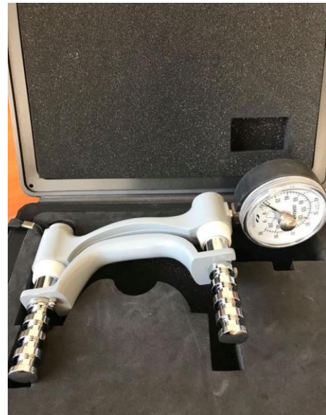
Slika 3. Dinamometar

Također u svrhu ispitivanja koristio se i dinamometar. Dinamometar je mjerni instrument koji služi za mjerenje sila. U ovome istraživanju dinamometar se koristio kao napor kako bi svi studenti primjenili jednaku silu jednak broj ponavljanja zbog učinkovitosti rezultata za mjerenje osjetljivosti prije i nakon napora.