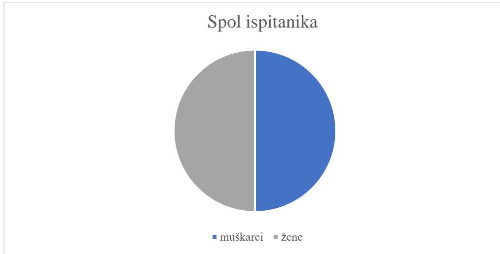
Slika 4. Spol ispitanika

Ispitivanje osjetljivosti dlana provodilo se na 10 muških i 10 ženskih studenata (vidljivo na slici 4). Ispitivanje se vršilo na tenaru, hipotenaru, te vrhu srednjeg prsta. Od 20 studenata 95 % studenata je s dominantnom desnom rukom dok preostalih 5 % ( 1 student ) pripada dominantnoj lijevoj ruci (vidljivo na slici 5). Kao što je prije već navedeno zbog provjere osjetljivosti prije i nakon napora mjerenje na svakom dijelu vršilo se 2 puta.