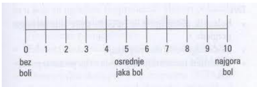
Slika 2 – procjena intenziteta boli na skali od 1 do 10