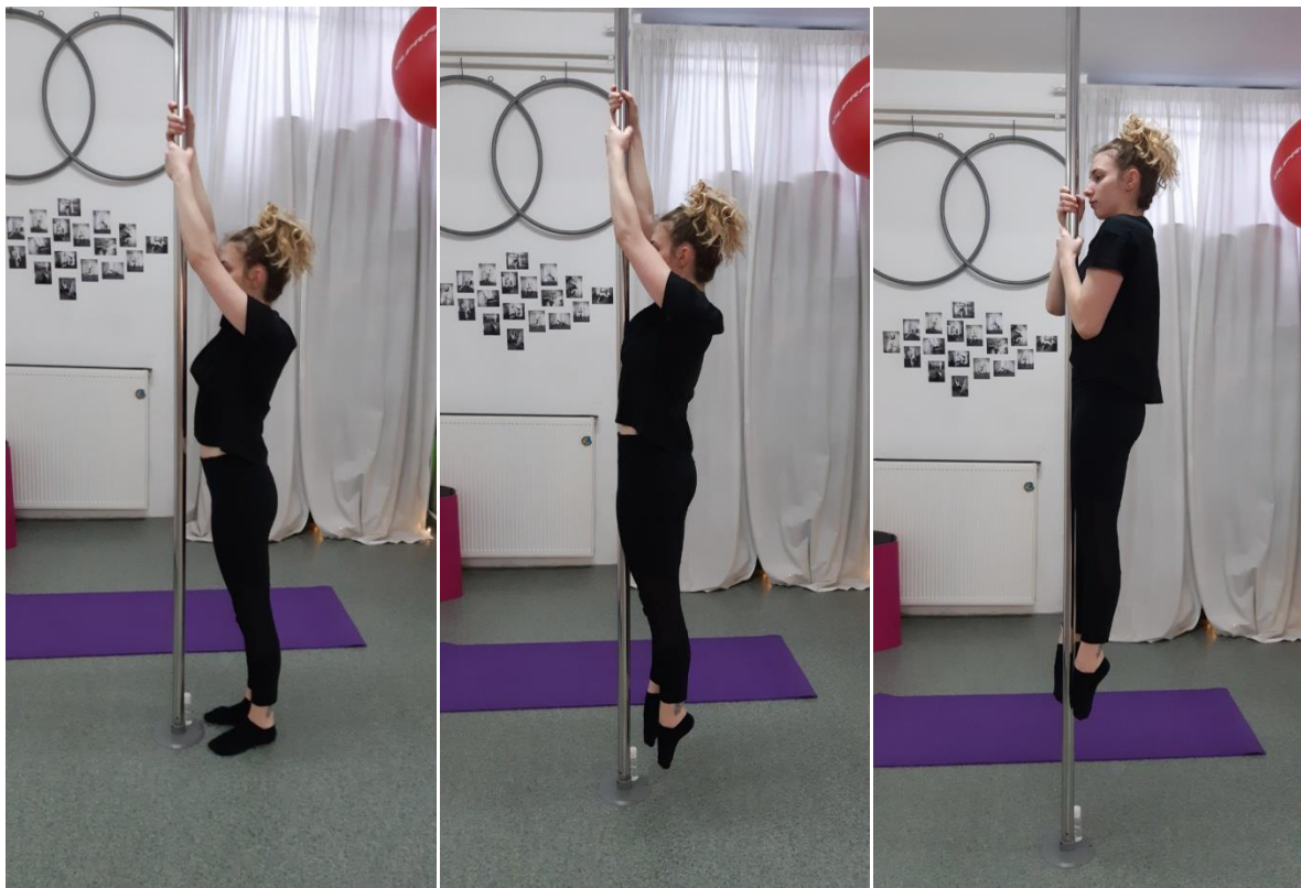
Slike 5., 6. i 7. Prikaz pravilne izvedbe zgibova na vertikalno postavljenoj šipci

Putanja kretanja: Tijelo se kreće okomito gore. Ključno je izbjegavati njihanje, trzanje ili „kljucanje bradom“.