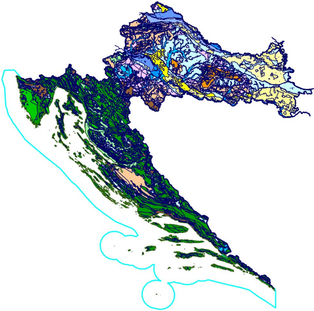
Slika 2. Hidrogeološka karta Republike Hrvatske M 1 : 300.000 [2]