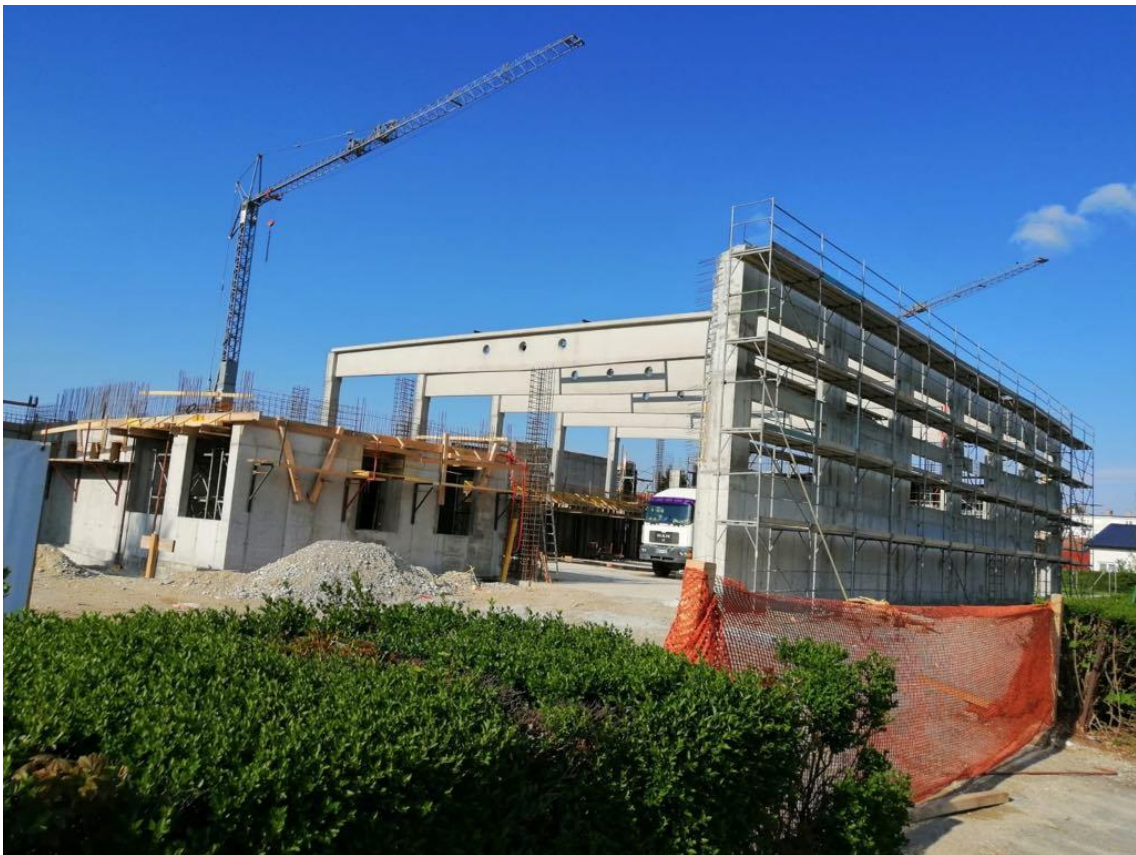
Slika 2. Prikaz konstrukcije gradnje dvorane

Hlađenje je jedino predviđeno u učionici informatike zbog odvajanja topline informatičke opreme. Tako se nazidu nalazi unutrašnje a s vanjske strane jedinica split rashladnog uređaja [3].