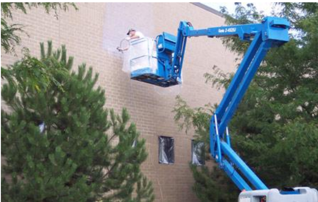
Slika 3 Prikaz održavanje pročelja građevine [9]

Redovito održavanje građevine obuhvaća provođenje skupa preventivnih mjera koje se provode prema prethodno utvrđenom planu i programu kako bi se trajno zadržala primjerena uporabljivost građevine tijekom njezina trajanja, te skup preventivnih ili interventnih mjera koje obuhvaćaju zamjenu, dopunu i/ili popunu dijelova građevine i ugrađene opreme u razmacima i opsegu određenim projektom građevine, odnosno u slučaju kada dio građevine više nije uporabljiv, a ta neuporabljivost nije posljedica kakvog izvanrednog događaja.