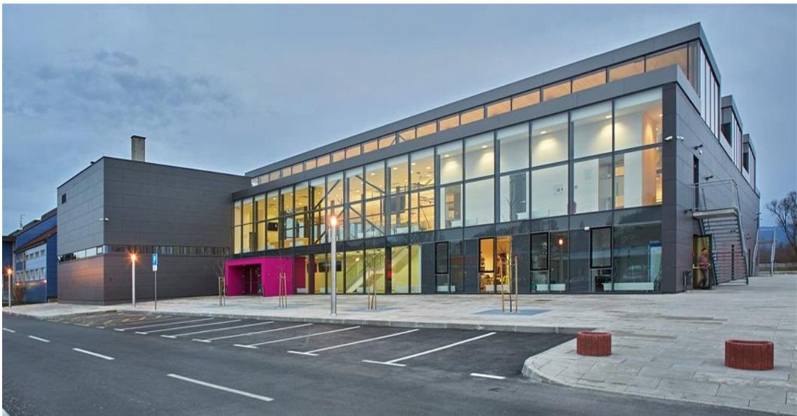
Slika 5. Sportska dvorana Zabok

Danas je dvorana u potpunoj funkciji kojom upravlja grad Zabok. Na slici 5. prikazan je današnji izgled dvorane.