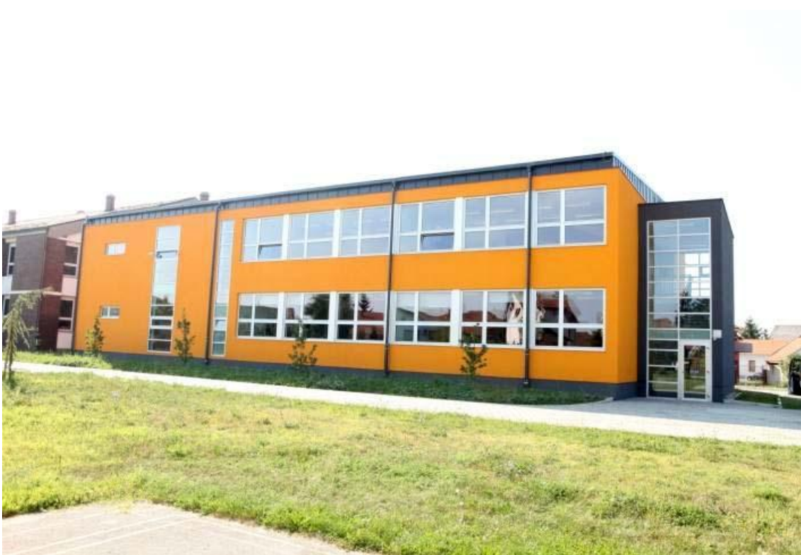
Slika 7. Sportska dvorana VI. osnovne škole u Varaždinu

U završnom radu su obrađeni samo građevinski radovi dvorane. Prema vremenskom planu izvođača izgradnja bi trebala biti gotova do 9.8.2019. Radovi nisu kasnili i danas je dvorana u potpunoj funkciji. Izgled dvorane može se vidjeti na Slici 7.