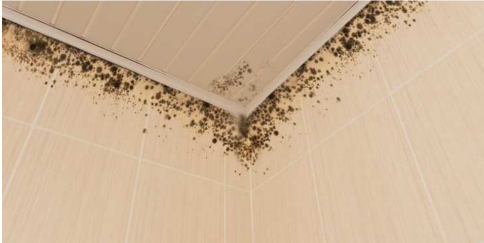
Slika 11.: Plijesan u kupaonici [11]