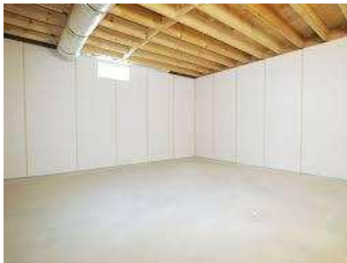
Slika 26.: Zidni paneli za odvodnju vode [26]

Još jedno rješenje koje se pokazalo učinkovitim su zidni paneli koji ostvaruju kanale za odvodnju infiltrirane vode. Voda se slijeva niz panele i akumulira u podnožju zida gdje se nalazi drenažni sustav.