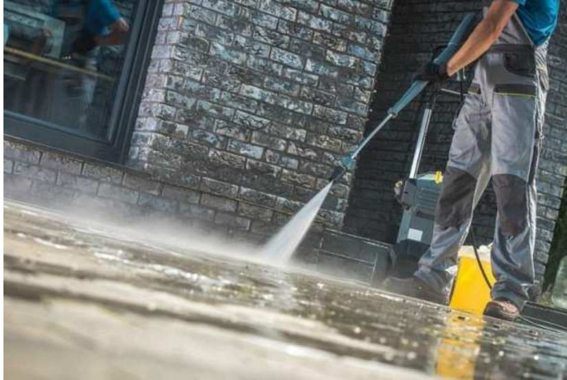
Slika 16.: Čišćenje vodom pod pritiskom [16]

Od štete najsigurnija metoda je natapanje vodom. Njome se stvara konstantan sloj vode na fasadi zgrade te nakon perioda natapanja, uklanja se pod pritiskom. Ipak, glavna mana ovog postupka je što se radi o velikim količinama vode koja može prodrijeti unutar fasade i opet stvoriti dodatne probleme. Namakanje vodom je dugotrajan proces jer naknadno sušenje fasade može potrajati tjednima.