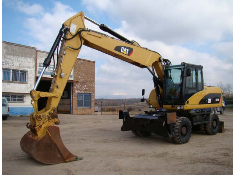
Slika 4: Jaružalo