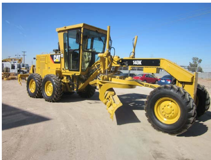
Slika 6: Grejder