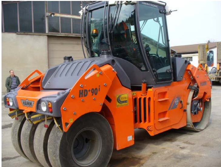
Slika 5: Valjak