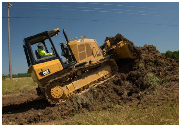
Slika 1: Buldozer