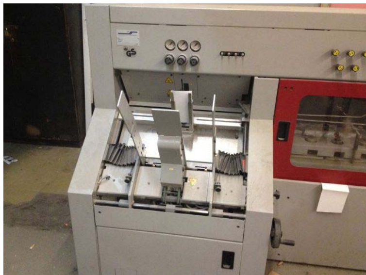
Slika 4. Ulagачi aparat

Tablica (1) prikaza grešaka na ulagaćem aparatu: