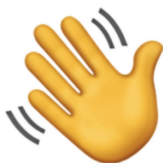
(slika 1., Waving hand , ruka koja maše)

uporaba ovisi o dobi korisnika, spolu i ekonomskome stanju. Emotikoni , kao i geste i znakovi u neverbalnoj komunikaciji, nisu transkulturalni. Na primjer, jedan emotikon u širem smislu, „ruka koja maše“ (slika 1.) u zapadnim zemljama predstavlja pozdrav, a u Kini predstavlja raskid veze ili prijateljstva.