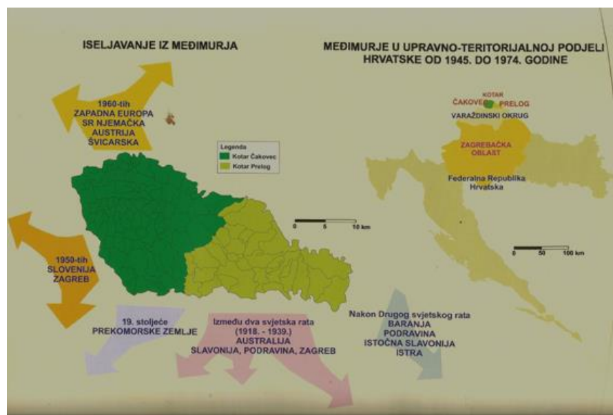
Slika 1. Smjerovi migracijskog kretanja međimurskog stanovništva

Smjerovi vanjske migracije kamo međimursko stanovništvo migrira uglavnom su posljedica geografske blizine i dobre prometne povezanosti. Ujedno su posljedica povijesno-političkih utjecaja u prošlosti (Mesarić Zabčić & Njegač, 2008: 129-131).