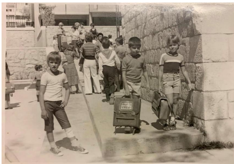
Slika 9 – Osnovna škola Vinko Paić Ožić