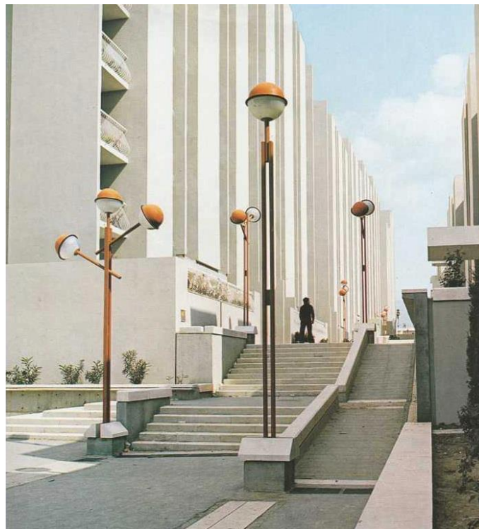
Slika 4 – Ulica Šime Ljubića