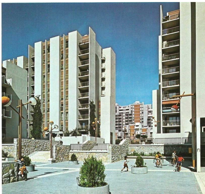
Slika 5 – Život na ulicama Trstenika