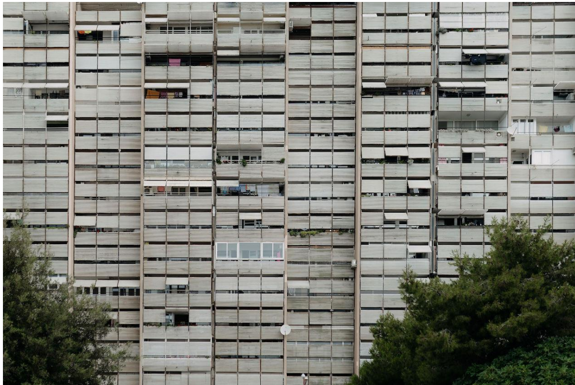
Slika 10 – Prepoznatljivi „brisoletji“ arhitekta Ive Radića