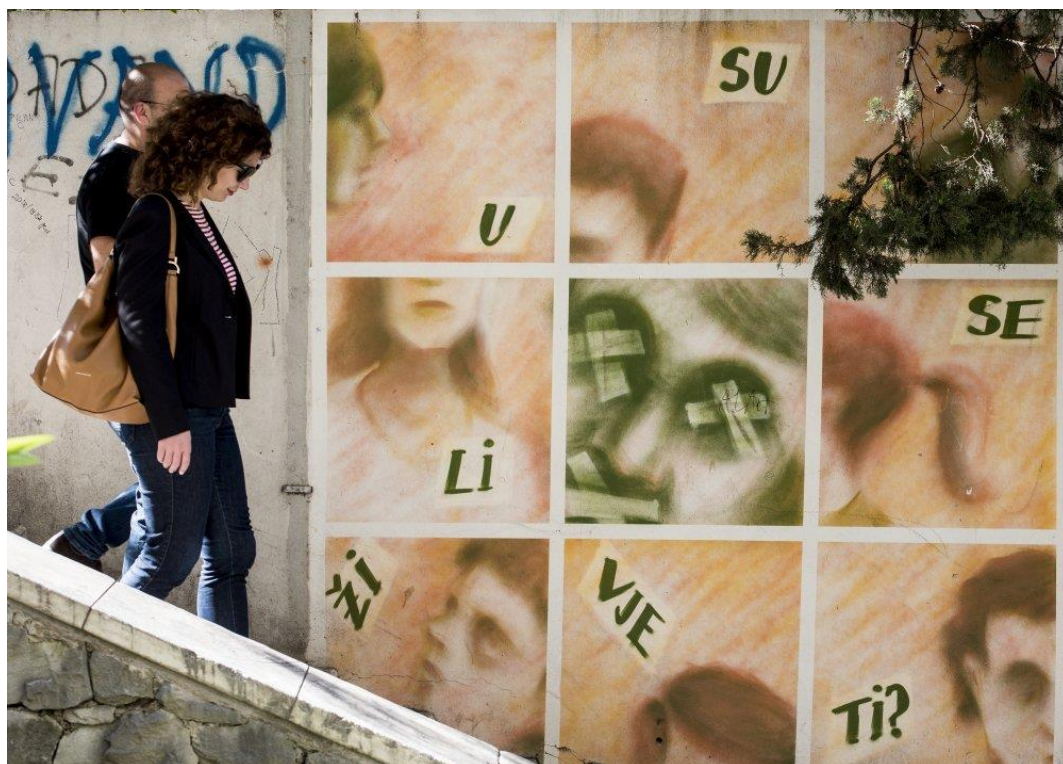
Slika 11 – Jedan od grafita Udruge Kvart