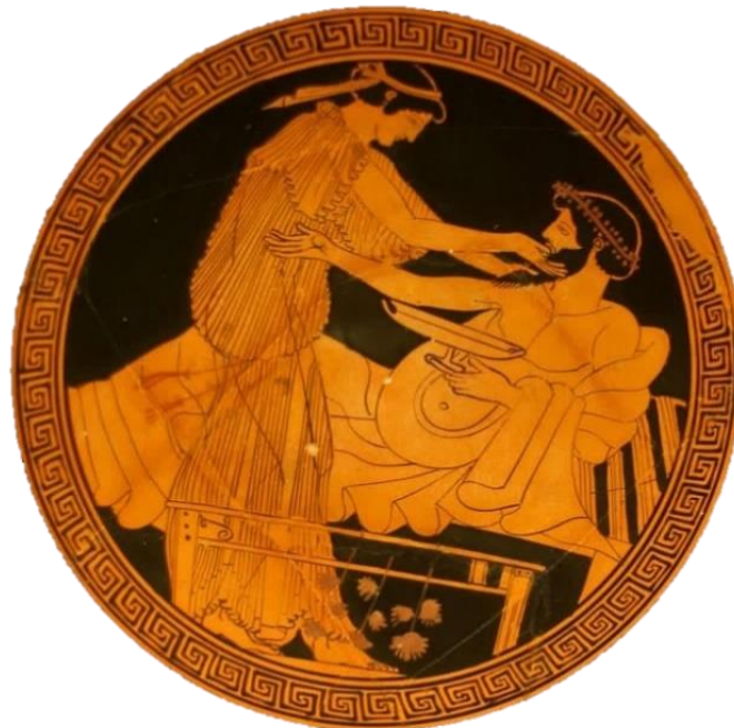
Slika 1. Prikaz Grka i hetaire (prostitutke visoke klase) iz unutarnje zdjele ili čaše s drškom (490.-480. pr. Kr.)

U antičkoj je Grčkoj bio razvijen i tradicionalni običaj „ mladoga ljubavnika “, u kojemu su stariji ljubavnici dječake između 12. i 18. godine podučavali ljubavnome umijeću, što bi se u današnjemu vremenu smatralo blago rečeno – neprihvatljivim. Sama je seksualnost toga doba bila vrlo izražena, što vidimo i po ostacima grčkoga antičkoga umijeća, poput raznoraznih slika ili ukrašenih vaza u kojima se jasno oslikava ondašnja povezanost društvenoga ranga i seksualne poze (Močibob, 2019, 8 navedeno u Knibiehler, 2004).