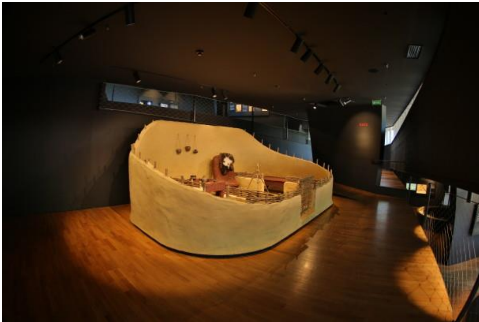
Slika 2: Vučedolska kuća – „košara“

Vučedolske su kuće su uglavnom bile četvrtaste, manjih dimenzija i potkovane ilovačom (Dimitrijević i dr. 1998:136-137). Većinom se ne nalaze ostatci kuća u cijelosti, nego njihove podnice, a primjeri „kuća“/objekata pronađeni su na lokalitetima Vinograd Streim, Kukuruzište Streim, Borinci i dr (Dimitrijević i dr. 1998:283). Završimo li u unutrašnjost kuće vučedolske kulture, uglavnom ćemo pronaći ognjište i jamu kao dva osnovna elementa. Osim toga, još su pronađeni i glineni žrtvenici koji govore o ritualnim navikama Vučedolaca; rituali su, osim zajednički, vjerojatno prakticirani i individualno (Dimitrijević i dr. 1998:137). Pronađene su i brojne jame, objekti ispod razine tla. Iako su uglavnom služile kao spremišta otpada, a u nekim su jamama pronađeni i posmrtni ostaci, mogle su imati još različitih funkcija. Les i zemlja korišteni su kao materijal za gradnju zidova i podova, a jame su dodatno bile zasute nekim otpadnim materijalima, bez obzira na funkciju koja im je bila namijenjena (Forenbaher, 1995:20).