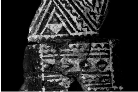
Slika 2: Inkrustacija