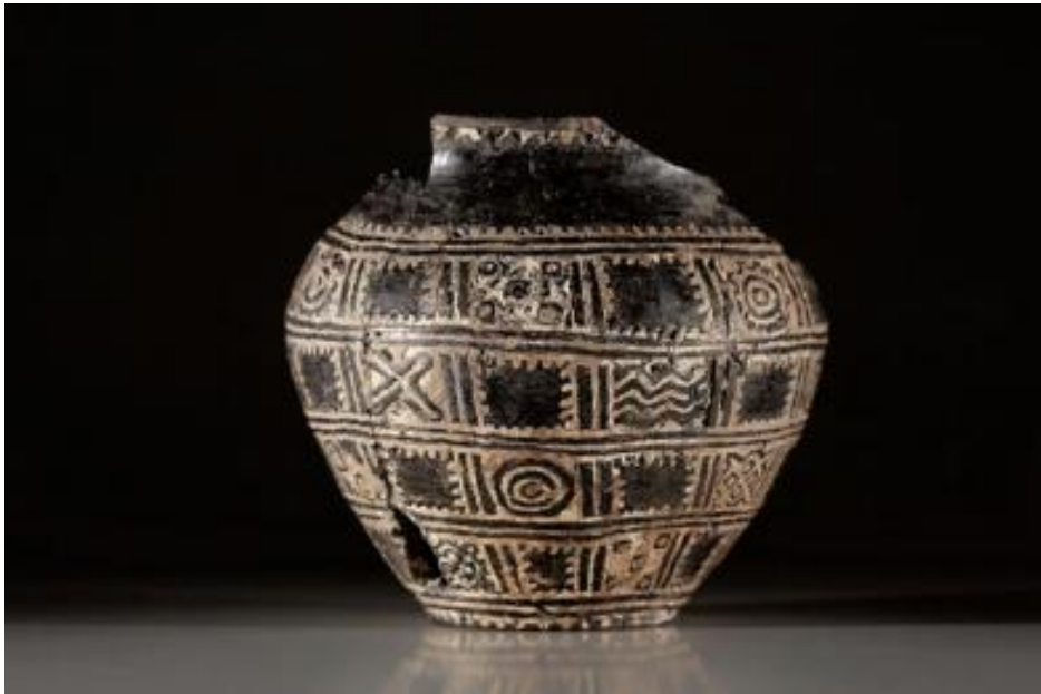
Slika 4. Posuda Orion s prikazom kalendara

donjemu dijelu, koji je zaštićen, imala tri kuglice pa je tako, osim kao kadionica, služila i kao zvečka. Ukrašena polja prikazuju simbol Venere (Markasović i Tomić, 2017:43). Zvečka je predstavljala nešto poput organa za ispravljanje problematičnosti vučedolskoga astralnoga kalendara, tj. njegovih nejasnih dana (Durman, 2000:118).