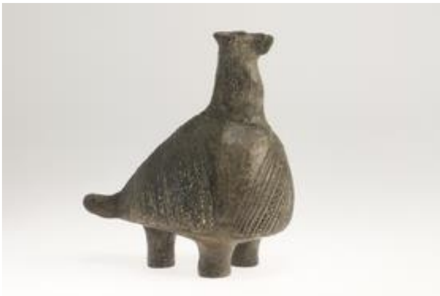
Slika 3: Vučedolska golubica

Jedan je nalaz s Vučedola postao i simbol cijele kulture i grada udaljenoga oko 5 km nizvodno od lokaliteta Vučedol, Vukovara, a to je tzv. vučedolska golubica koja je pronađena ispred megaronskoga ulaza. Prvotno je artefakt nazvan kokoš i tako prozvan i zapisan u arheološki zapisnik. Ipak, kasnije dolazi do saznanja da je kokoš na prostor na kojemu je keramička posuda pronađena, i općenito u ove dijelove Europe, došla par tisuća godina kasnije. Danas u arheološkim krugovima prevladava spor je li riječ o golubici ili jarebici. Bilo kako bilo, danas nema nedoumice o kojemu se točno predmetu radi kada se upotrijebi naziv „vučedolska golubica“. Ona je služila kao kadionica i imala obrednu ulogu za neki od rituala koji su tada prakticirani. Što se tiče umjetničkog aspekta, ona predstavlja klasični primjer ukrašavanja keramike za fazu B1 – tamne je boje, ukrašena bijelim linijama, a na vratu se nalaze tri simbola klepsidre, tj. dvostruke sjekire, često upotrebljavanoga simbola. Pronađeni su još neki primjeri barskih ptica na prostoru rasprostiranja kulture, a one se vežu uz solarne kultove, tako da nije isključena mogućnost da je golubica služila u nekome od njih (Markasović i Tomić, 2017: 36-37). Danas je originalna vučedolska golubica izložena u Arheološkome muzeju u Zagrebu.