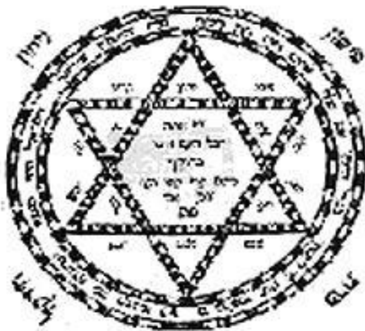
Slika 1. Amulet iz srednjeg vijeka, prikazan u djelu Sefer Raziel 32