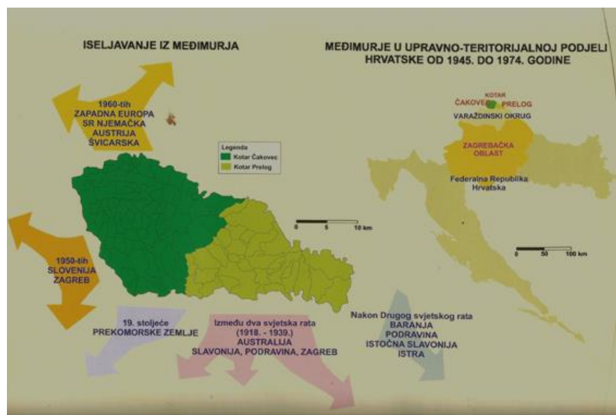
Slika 1. Smjerovi migracijskog kretanja međimurskog stanovništva

Smjerovi vanjske migracije kamo međimursko stanovništvo migrira uglavnom su posljedica geografske blizine i dobre prometne povezanosti. Ujedno su posljedica povijesno-političkih utjecaja u prošlosti (Mesarić Zabčić & Njegač, 2008: 129-131).