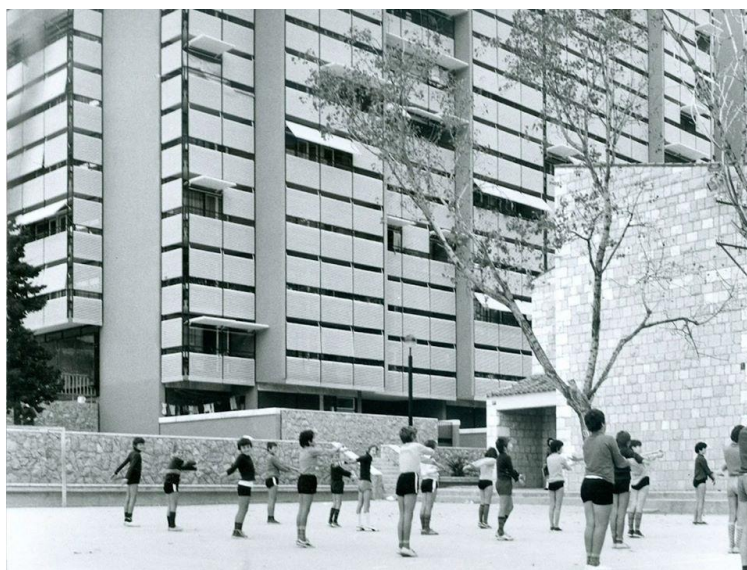
Slika 8 – Sat gimnastike ispred Osnovne mješovite škole „Naroda Lučca“