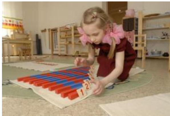
Slike 3.-6. Montessori materijali