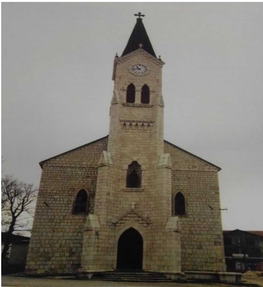
Župna crkva u Posušju 1996. 20

i arhitekata, trebalo vratiti izvorni izgled kako bi svojom kamenom ljepotom opet bila ures Posušja, kao nekada. 19