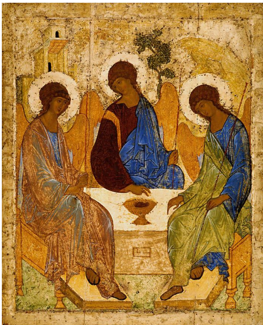
(Rubljov, Sveta Trojica, Tetjakov galerija, Moskva)