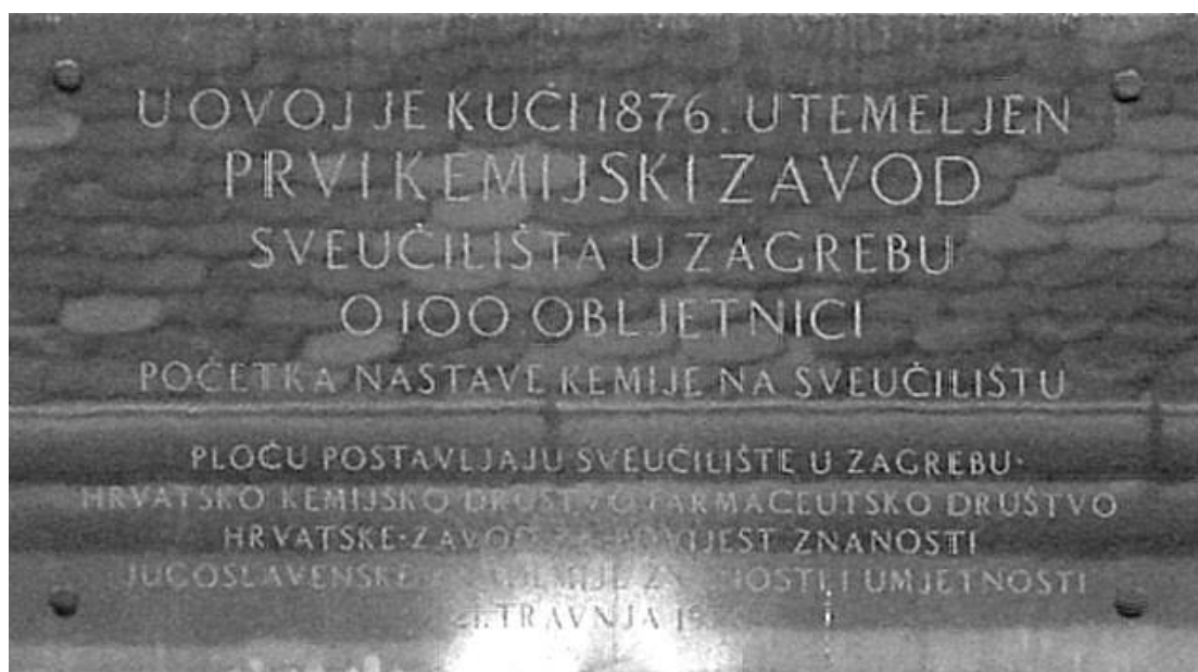
SLIKA 3. Spomen ploča na zgradi u Novoj Vesi broj 1 u Zagrebu, u kojoj je bio smješten prvi sveučilišni kemijski laboratorij u Hrvatskoj [5]

Kako bi se opremio kemijski laboratorij bilo je potrebno sastaviti troškovnik za potreban pribor i izvođenje potrebnih radova. U tu svrhu prof. Veljkov, u prosincu 1876. godine, odlazi na put u Beč da pribavi potreban pribor i materijale. Također 1877. godine odobrava se donacija za nabavu pribora i kemikalija za novonastali kemijski laboratorij. Kao