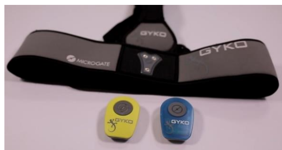
Slika 4. Gyko sustav

Za vrijeme testiranja Gyko senzor je smješten na ispitaniku kod predručenja i odručjenja na lateralnoj strani nadlaktice, a kod prednoženja na lateralnoj strani natkoljenice. Postavljeni senzori ne utječu na izvedbu.