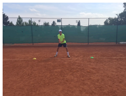
Slika 4. Vježba 3

Vježba 4. Ova vježba je slična prethodnoj. Također su postavljena dva čunja razmaknuta 5 metara na osnovnoj liniji u istoj ravnini te igrač izvodi kretanje do čunja, izvodi udarac te prolazi okonjega i vraća se u središnju poziciju nakon čega slijedi trčanje na drugi čunj, udarac prolaz oko njega pa vraćanje u središnju poziciju. Intenzitet iznosi 95% od maksimuma, a trajanje serije iznosi 20 sekundi. Interval odmora nakon serije je 20 sekundi. Izvodi se šest serija nakon čega slijedi interval odmora u trajanju od 90 sekundi. Svrha vježbe je razvoj anaerobne fosfagene izdržljivosti.