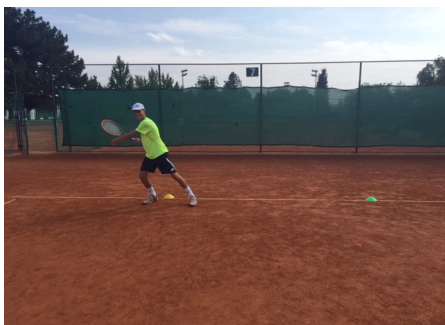
Slika 3. Vježba 3

Vježba 3. Postavljena su dva čunja razmaknuta 5 metara na osnovnu liniju u istoj ravnini te igrač izvodi kretanju u obliku osmice simulirajući udarce. Intenzitet iznosi 95% od maksimuma. Trajanje serije iznosi 20 sekundi, a interval odmora nakon serije iznosi 20 sekundi. Izvodi se pet serija, a nakon pete serije slijedi interval odmora u trajanju 90 sekundi. Svrha vježbe je razvoj anaerobne fosfagene izdržljivosti.