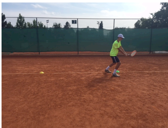
Slika 5. Vježba 4

Vježba 5. Trener izbacuje iz košare lopte igraču na forhend. Igrač ima obavezu kretanja oko čunja nakon svakog odigranog udarca. Čunj se nalazi na sredini osnovne linije. Igrač odigrava jednu forhend dijagonalu i paralelu. Intenzitet 95% od maksimuma. Trajanje serije iznosi 15 sekundi. Interval odmora nakon serije je 20 sekundi. Izvodi se šest serija nakon čega slijedi odmor od 90 sekundi. Svrha vježbe je razvoj anaerobne fosfagene izdržljivosti. Ova vježba je slična vježbi 2., samo se izvode udarci.