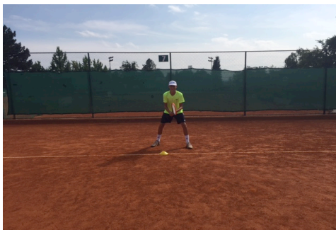
Slika 2. Vježba 2 - početni položaj

između gemova. Svrha vježbe je razvoj anaerobne fosfagene izdržljivosti.