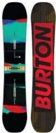
Slika 5.1.1.1.: Freeride daske

Freeride daske raspoznatljive su po njihovoj dužini koja može sezati i do 180 cm. Spadaju u srednje tvrde daske. Imaju mekše vrhove. Bočni luk je srednje velik. Rep i krivina su uzdignuti. (ZTUSH, 2009:6) (Slika 5.1.1.1.)