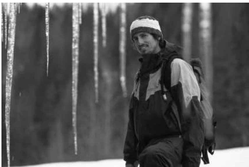
Slika 3.1.: Craig Kelly

Kada je Craig Kelly (Slika 3.1.), odbio milijunske ugovore i napustio tada veoma popularno „mainstream“ daskanje na snijegu kako bi se posvetio freerideu , industrija daskanja na snijegu je ostala šokirana. Jedan od najboljih snowboardera svijeta, čovjek koji je zadužio daskanje na snijegu, odjednom je sve to napustio kako bi se posvetio vožnji po neistraženom terenu opasnih planina.