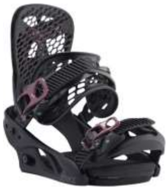
Slika 5.3.2.1.: Polutvrdi vezovi

Polutvrdi vezovi nazivaju se i step-in vezovima. Na njih se cipela pričvršćuje sa strane ili na potplati cipele. (ZTUSH, 2009:11) (Slika 5.3.2.1., 5.3.2.2.)