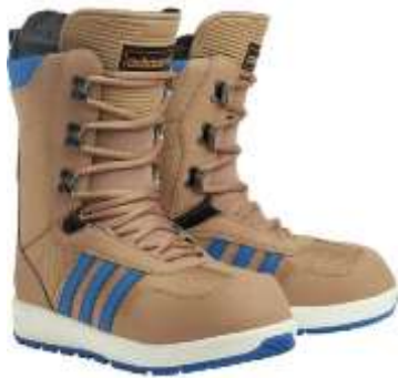
Slika 5.2.3.1.: Meke buce