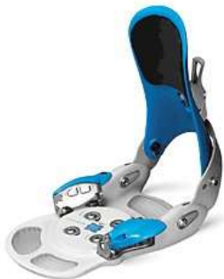
Slika 5.3.2.2.: Step-in vezovi