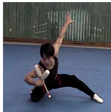
Slika 5: Čunjevi