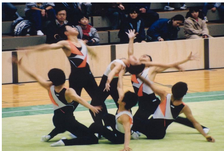
Slika 1: Grupna vježba

Što se tiče samog natjecanja, suci moraju biti udaljeni od samog partera minimalno 4m. Natjecatelji se mogu natjecati individualno odnosno pojedinačno ili u skupinama odnosno grupno. Kod grupnih natjecanja broj natjecatelja po grupi je 5 ili maksimalno 6. Ovisno o tome natječete li se u skupinama ili pojedinačno ima propisano vrijeme izvođenja vježbe. Skupne vježbe traju od 2 minute 30 sekundi do maksimalno 3 minute, dok individualne vježbe traju od 1 minute do 1 minute 30 sekundi. Ovaj sport se ponekad naziva i sinkronizirana gimnastika zbog toga što kombinira dinamične moćne akrobacije sa savršenim sinkroniziranim pokretima.