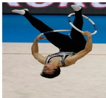
Slika 3: 2 mala koluta