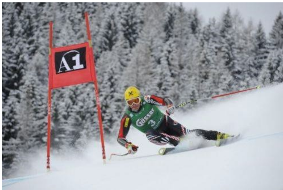
Slika 10. Natjecatelj u disciplini – superveleslalom

do 600 m, a za žene 400 m do 600 m. Vrata se sastoje od četiri slalomskih štapova sa zastavicama, a postavljena su naizmjenično plava i crvena. Širina vrata minimalno je 6 metara, a maksimalno 8 metara. Minimalan broj postavljenih vrata je trideset. Širina staze iznosi 30 m, a razmak između štapova je minimalno 25 m. Staza se postavlja na stazi za spust i vozi se jedna vožnja.