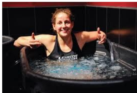
Slika 2. Hladna kupka.

Uranjanje u hladnu vodu je najčešće korištena metoda hlađenja u profesionalnom sportu. Sastoji se od uranjanja cijelog tijela u hladnu vodu ili lokalnog uranjanja, većinom ekstremiteta koji je bio pod najvećim stresom tokom neke aktivnosti. Temperatura takve vode mora biti <15°C i protokol obično traje nekoliko minuta. Postoji velik broj istraživanja koja su proučavala učinke hladnih kupki na oporavak sportaševa organizma, a vjeruje se da najveći učinak ima na smanjenje upale mišića (DOMS) te na bolju vlastitu percepciju umora (Bleakly i sur., 2012).