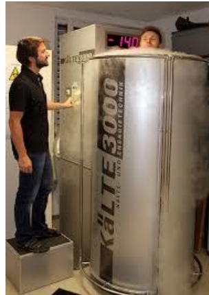
Slika 4. Parcijalna krioterapija dušikom.

potreban spremnik tekućeg dušika, takve komore su prijenosne i zbog toga se lako mogu privremeno postaviti u sportske objekte tokom natjecanja