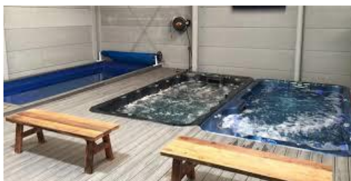
Slika 3. Primjer bazena s toplom i hladnom vodom.

Primjena kontrastnih kupki izmjenjujući toplu i hladnu vodu je alternativna metoda samom hlađenju često korištena u sportu. Kontrastne kupke su terapija u kojoj sportaš prvo bude uronjen u toplu vodu, a odmah zatim u hladnu vodu. Taj proces se obično ponavlja nekoliko puta i traje otprilike 5 do 10 minuta. Istraživanja sugeriraju da kontrastne kupke mogu smanjiti edeme, mišićne spazme i upalu, te povećati opseg pokreta izmjenjujući perifernu vazokonstrikciju i vazodilataciju (Biezun i sur., 2013). Kontrastne kupke su također bile učinkovite u smanjenoj percepciji boli 24, 48 i 72 sata nakon ekscentričnog treninga (Vaile i sur., 2008).