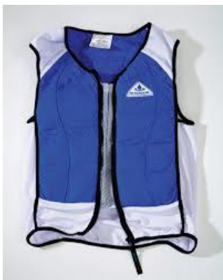
Slika 6. Prsluk za hlađenje.

Prsluci se kao metoda hlađenja koriste većinom prije trenažne ili natjecateljske aktivnosti u uvjetima visoke temperature i vlažnosti zraka. Visoko intenzivne aktivnosti u takvim uvjetima mogu dovesti do povećane temperature tijela što u konačnici može rezultirati padom sposobnosti sportaša. Prsluci su izrađeni od različitih materijala i imaju vezice kako bi se prsluk mogao utegnuti da što bolje pristaje sportašu. Neka istraživanja pokazuju da takvi prsluci dizajnirani posebno za sportske aktivnosti osiguravaju značajnu prednost sportašima koji izvode repetitivne tjelesne aktivnosti u uvjetima visoke temperature i vlažnosti zraka (Webster i sur., 2005).