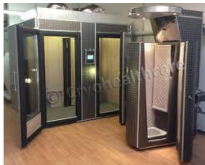
Slika 5. Komore za krioterapiju cijelog tijela.

Kriogene komore za terapiju cijelog tijela sastoje se od glavne komore te jedne ili više pomoćnih komora. Da bi se zrak u prostorijama ohladio, tekući dušik prolazi kroz cijevi unutar zidova komore. Kod ove metode sportaš nikad ne dolazi u direktan kontakt sa hladnim medijom. U komorama može boraviti dvoje ili više ljudi koji moraju imati zaštitnu odjeću za stopala, ruke, nos, usta i uši. Pomoćne komore su na temperaturi od -60^{\circ}\text{C} te služe za aklimatizaciju, a sportaši u njima provode minimalno 30 sekundi prije ulaska u glavnu komoru gdje je temperatura između -110^{\circ}\text{C} i -140^{\circ}\text{C} . U glavnoj komori se obično provodi 2 do 3 minute.