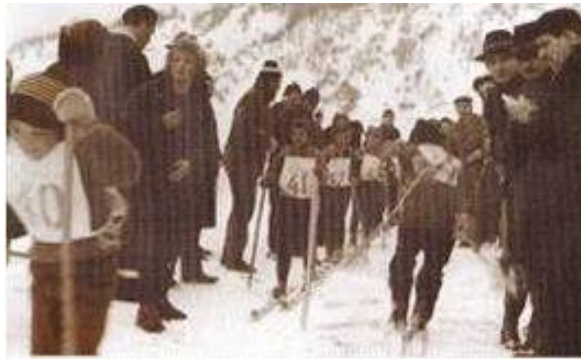
Slika 5. Prvenstvo u Mrkoplju

održanog u Mrkoplju 1914. godine, organizirano je prvo Prvenstvo Hrvatske i Slavonije u skijaškom trčanju. Uz novčanu pomoć obitelji Lipovac, prema nacrtu ing. Rožmana 1934. godine izgrađena je skakaonica. Norvežanin Jahr je na natjecanju skočio čak 46 m. Sljedećih godina održana su natjecanja u skijeringu s konjskom zapregom, zatim utrke gdje psi vuku skijaše na saonicama. Što se tiče skijaških skokova, Mrkopaljci se nisu proslavili, često su padali iz razloga što nisu imali stručnu osobu da im pokaže. Nakon toga, ubrzo je izgrađena, nova, kraća skakaonica do 30 metara, bilo je to 1937.-1938. godine. Domaći stolari izradili su skije za skakanje te su ovoga puta uspješnije izvodili skokove. Od značajnih natjecanja 1967. godine na Čelimbaši je održan noćni slalom pod bakljama što je svjetski poznati događaj. Godinu kasnije, vozio se dnevni slalom gdje su sudjelovala 53 skijaša. U sklopu Memorijala održavaju se skokovi na deset metarskoj skakaonici 1972. godine (Općina Mrkopalj, 2003).