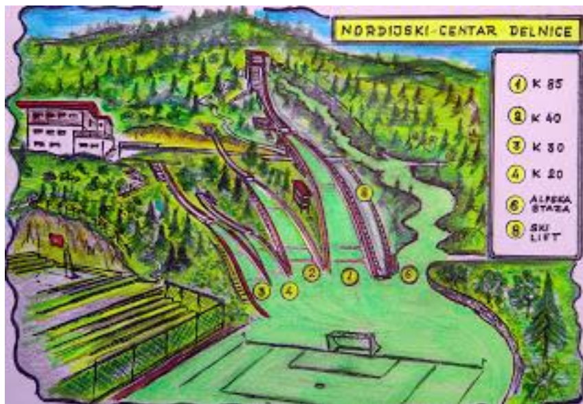
Slika 2. Prikaz plana izgradnje Nordijskog centra Delnice

“Grad Delnice u izgradnji je prateće infrastrukture ovih objekata uložio je 138000 kuna, a svota potrebna za daljnje radove vezane uz postavljanje pragova i plastike još nije određena, iako se zna da će plastika biti postavljena na skakaonice od 8 i 25 m, dok za trideset metarsku skakaonicu postoji obećanje Međunarodnog olimpijskog komiteta koji će taj novac osigurati iz sredstava solidarnosti. No, to, kao i radovi na izgradnji četrdeset pet metarske skakaonice, odnosno proširenja sedamdeset metarske na skakaonicu od 80-85 m sada su u drugom planu. Najbitnije je prije jeseni urediti ove dvije male skakaonice kako bi mali goranski skakači i skakačice napokon mogli svakodnevno trenirati u Delnicama” (Grad Delnice zeleno srce Hrvatske, 2009).