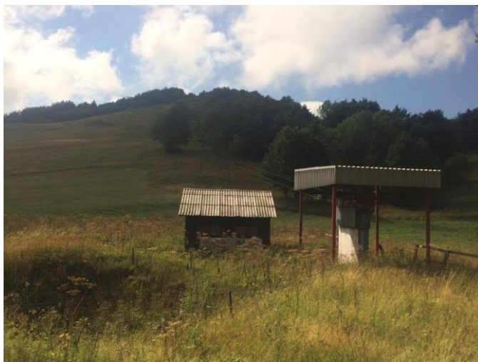
Slika 11. Prikaz dijela skijališta u Begovom Razdolju u ljeto 2017. godine

Skijalište Begovo Razdolje nalazi se točno preko puta hotela “Jatreb” i dio je Olimpijskog centra Bjelolasica koji danas nije u funkciji. Inače je najviše naseljeno mjesto u Hrvatskoj koje se nalazi na 1078 mnv. Skijalište ima jednu stazu duljine 1000 m i vučnicu Sidrašicu duljine 400 m koja se penje na Klobučarev vrh (1215 m). Mjesto je okruženo planinama i šumskim stazama te je idealno za visinske pripreme sportaša i planinarenje. Staza je na vrhu dosta uska, spuštajući se prema dolje je sve šira. Vrh je često opasan zato što se brzo napravi led koji uglavnom stvara probleme. Ovdje je rođen Jakob Mihelčić, jedan od prvih hrvatskih planinarskih vodiča, koji je otkrio Bijeje i Samarske stijene, a one su danas strogi rezervat prirode (Muhvić, 2004).