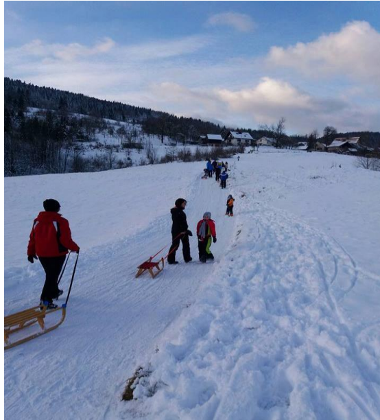
Slika 23. Staza u Vujnovićima