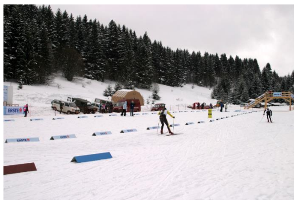
Slika 13. Biatlon centar Zagemajna