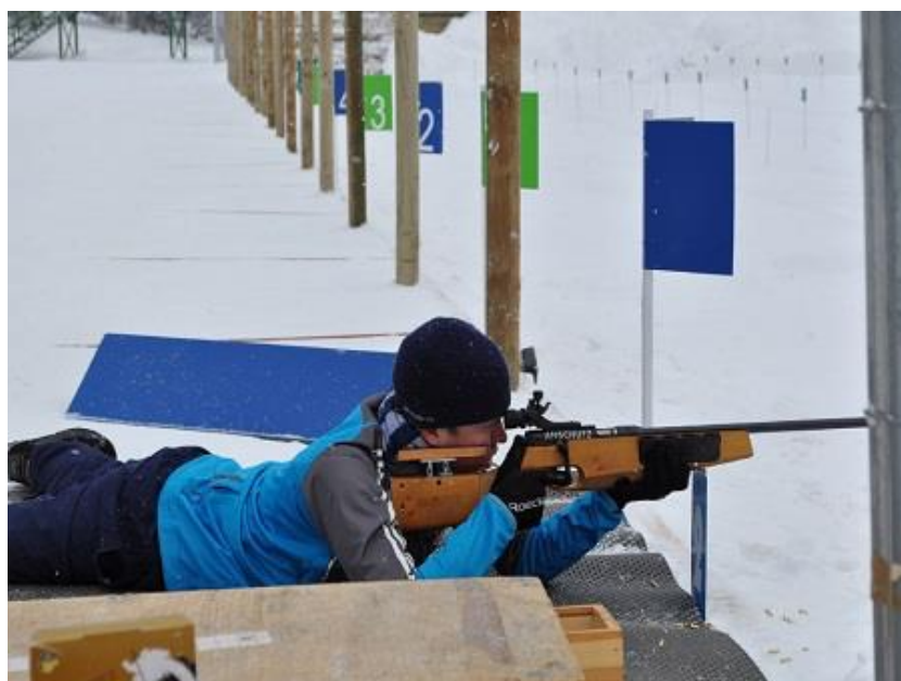
Slika 15. Prvenstvo šumara Europe na Vrbovskoj poljani

U ovom nordijskom centru 2013. godine održana je najveća sportska zimska manifestacija koja je ikada održana u Hrvatskoj. Održano je Prvenstvo šumara Europe u nordijsko-pucačkim disciplinama koje je brojalo čak 1500 učesnika. Organizatori su bili Općina Mrkopalj i Hrvatske šume.