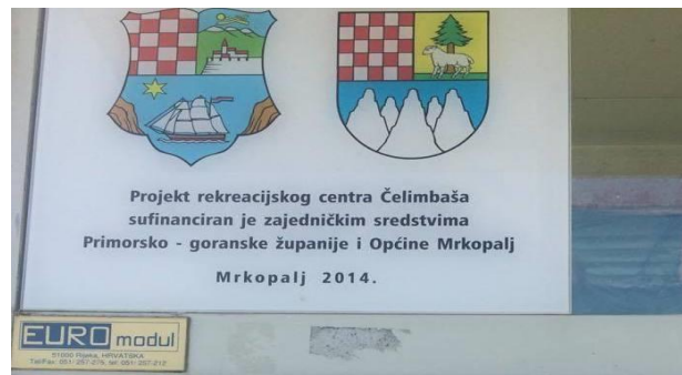
Slika 8. Natpis načina financiranja skijališta

U razgovoru s nadležnima, skijalište je prethodnu zimu bilo u funkciji pet dana što je jako tužno za jedan skijaški centar i cijeli Gorski kotar. Riječ je o “slabim” zimama, pretopla klima, južni vjetar i kao posljedica svega dolazi do brzog topljenja snijega. S obzirom na skoro nikakva ili mala ulaganja zbog lošeg financijskog stanja, skijalište iz godine u godinu sve više propada, nemogućnost kupnje snježnih topova i nezainteresiranost same države oko ovakvih investicija ne dovodi do pozitivnih rezultata.