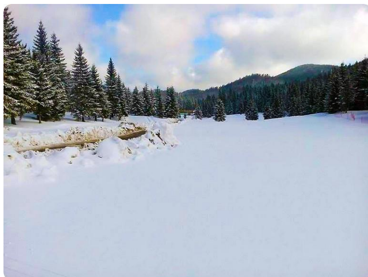
Slika 14. Vrbovska poljana