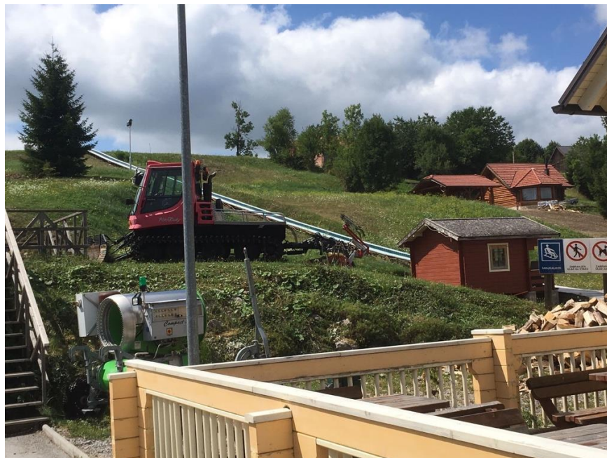
Slika 19. Sanjkalište u Kupjaku, ljeto 2017. godine

sanjkanje pod reflektorima. Osim sanjkanja, posjetitelji si mogu priuštiti i noćenje uz samu stazu u novoizgrađenom objektu “Gina B&B” i uživati u bogatoj gastronomskoj ponudi (Sanjkanje u Gorskom kotaru, 2011).