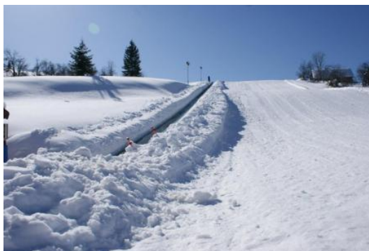
Slika 20. Sanjkalište zimi

Na sanjkalištu je 2015. godine organiziran “Sanjkaški kup Gorskog kotara” pod pokroviteljstvom Hrvatskog saveza sportske rekreacije “Sport za sve”. Zaključno, ovo je jedna jako lijepa investicija koju posjećuju ljudi iz cijele Hrvatske, uživajući u zimskim radostima u srcu Gorskoga kotara.