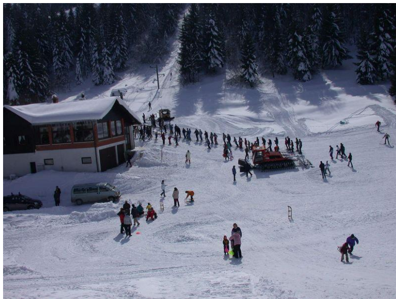
Slika 21. Skijalište “Rudnik” u Tršću