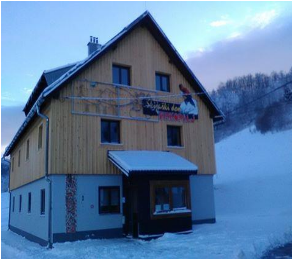
Slika 9. Skijaški dom “Mrkopalj”

Nedavno je otvoren hostel uz samo skijalište sa smještajnim kapacitetom od šest dvokrevetnih i dvije četverokrevetne sobe uz odličnu gastronomsku ponudu i pristupačne cijene. U hostelu se također organiziraju različite skijaške zabave i priredbe. Također u domu postoji mogućnost iznajmljivanja skijaške opreme, ski servis i licencirani učitelji za ski školu.