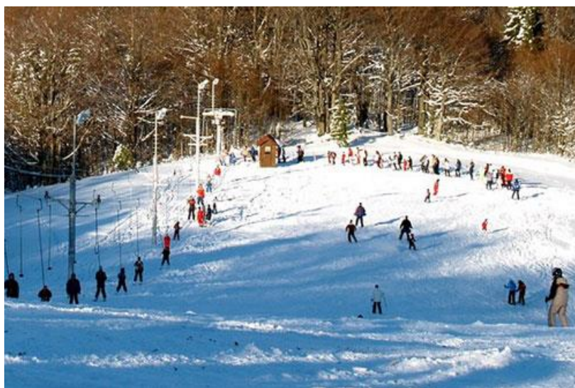
Slika 4. Skijaški centar "Petehovac"