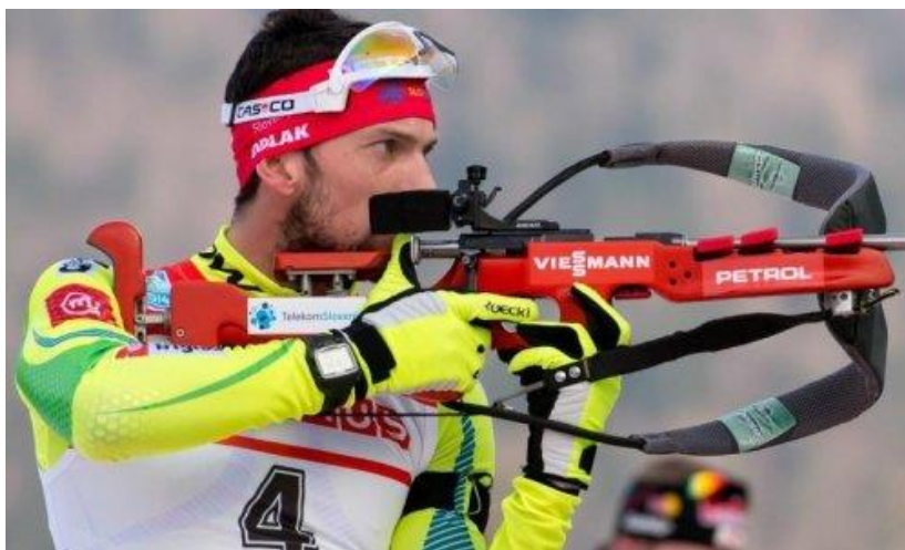
Slika 16. Jakov Fak

Naime, zbog manjka financijskih sredstava, Jakov je jedno vrijeme sam trenirao u Mrkoplju jer savez nije imao novaca plaćati da trenira sa slovenskom reprezentacijom. Zbog loše situacije koja se odužila, Jakov je tražio ispisnicu iz Hrvatskog biatlonskog saveza te se priključio slovenskoj reprezentaciji. Pod zastavom Slovenije postao je svjetski biatlonski prvak u njemačkom Ruhpoldingu na utrci od 20 km.