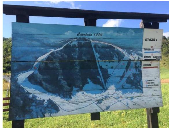
Slika 5. Mapa skijališta

za proizvodnju umjetnog snijega kako bi skijalište što dulje u zimskim mjesecima bilo u funkciji.