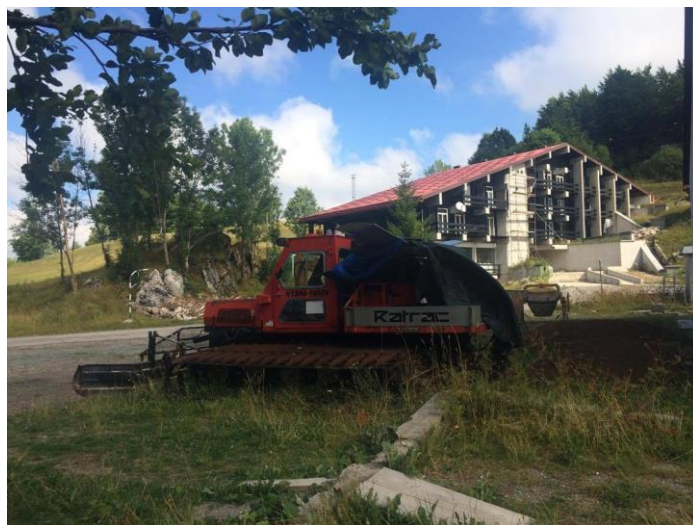
Slika 12. Hotel "Jastreb" i stroj za uređivanje staze, slikano u ljeto 2017. godine

sanjkanje, dodatno proširenje izbora sportova na snijegu, različite aktivnosti za djecu, a time bi gosti imali i gdje boraviti.