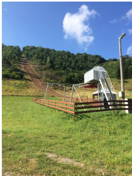
Slika 7. Prikaz vučnice u ljeto 2017. godine

Skijalište Čelimbaša nalazi se u mjestu Mrkopalj, udaljenom desetak kilometara od mjesta Ravna Gora, odnosno 15 km od grada Delnice. Što se tiče samog položaja skijališta, vrlo je povoljan iz razloga što kada siđete s autoceste Rijeka-Zagreb na izlazu Delnice, nastavite starom cestom prema Rijeci i za čas ste na skijalištu. Mjesto Mrkopalj nalazi se na 824 mnv, okruženo brdima Čelimbaša i Maj. Vrh Čelibaše nalazi se na 1084 mnv, u podnožju nalaze se tanjurići dužine 750 m koji vuku skijaše na vrh. Za razliku od vučnice na Petehovcu koja je na blagom terenu, vučnica je relativno strma i ne preporuča se djeci mlađoj od 10 godina.