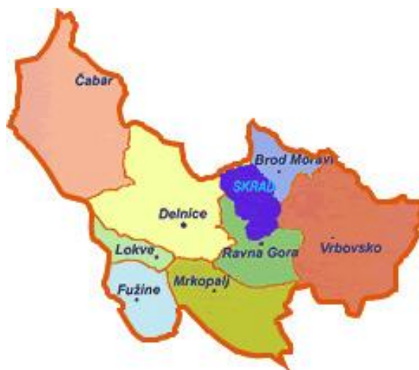
Slika 1. Zemljopisna karta Gorskoga kotara