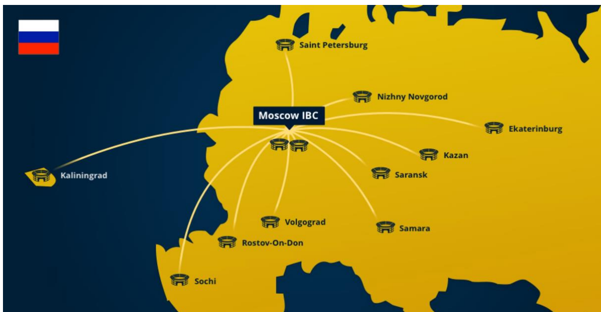
Slika 4. Međunarodni centar za emitiranje