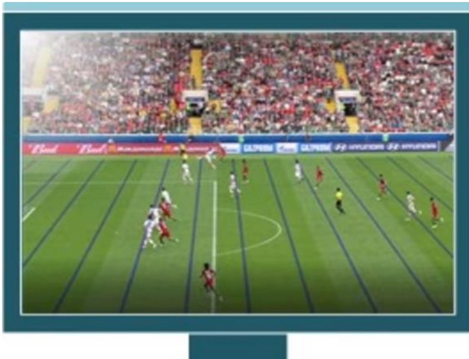
Slika 3. AVAR2