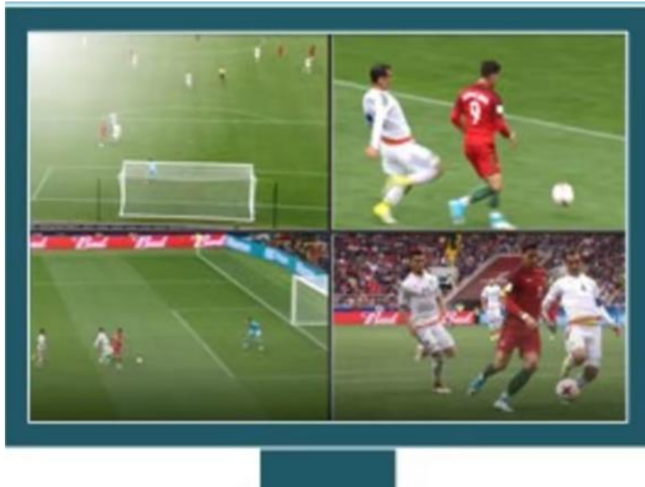
Slika 1. Četverostruki zaslon