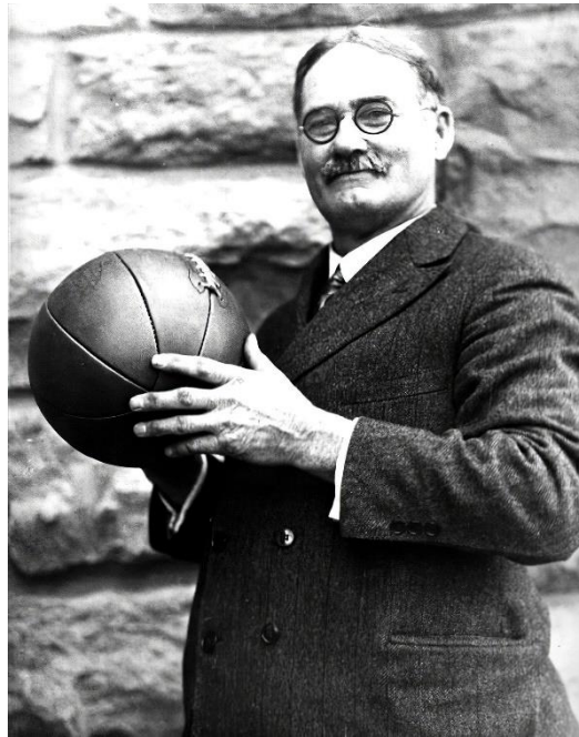
Slika 1. James Naismith