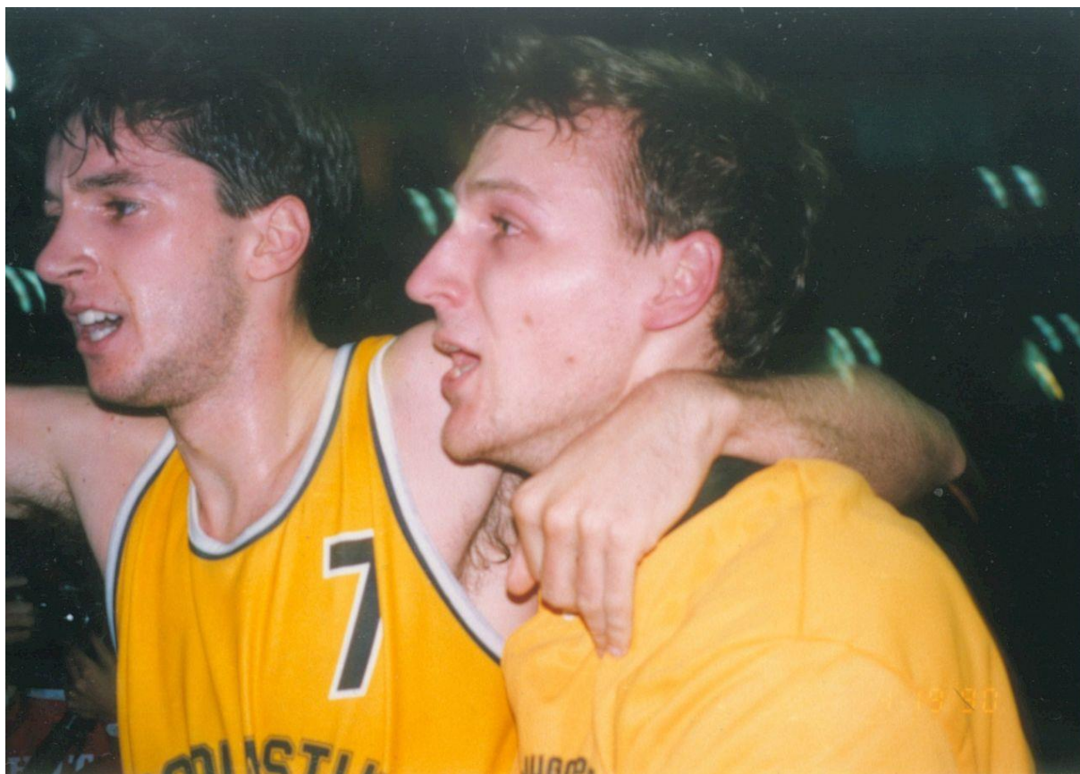
Slika 3. Toni Kukoč i Dino Rađa 1990. nakon pobjede