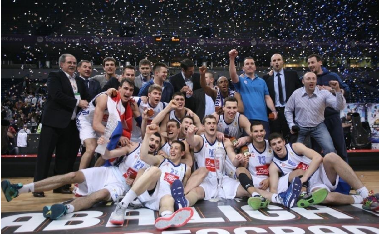
Slika 2. Cibona osvajač ABA lige 2014.